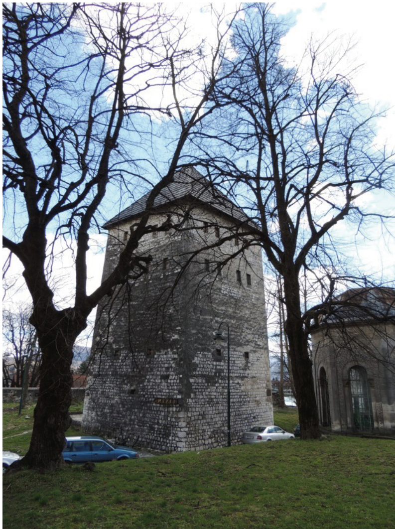
obr. 2 Bihać – Kapetanova kula