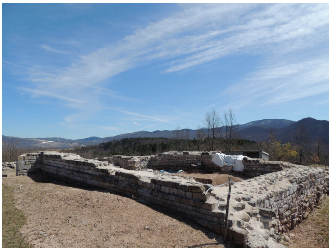
obr. 5 Krbava