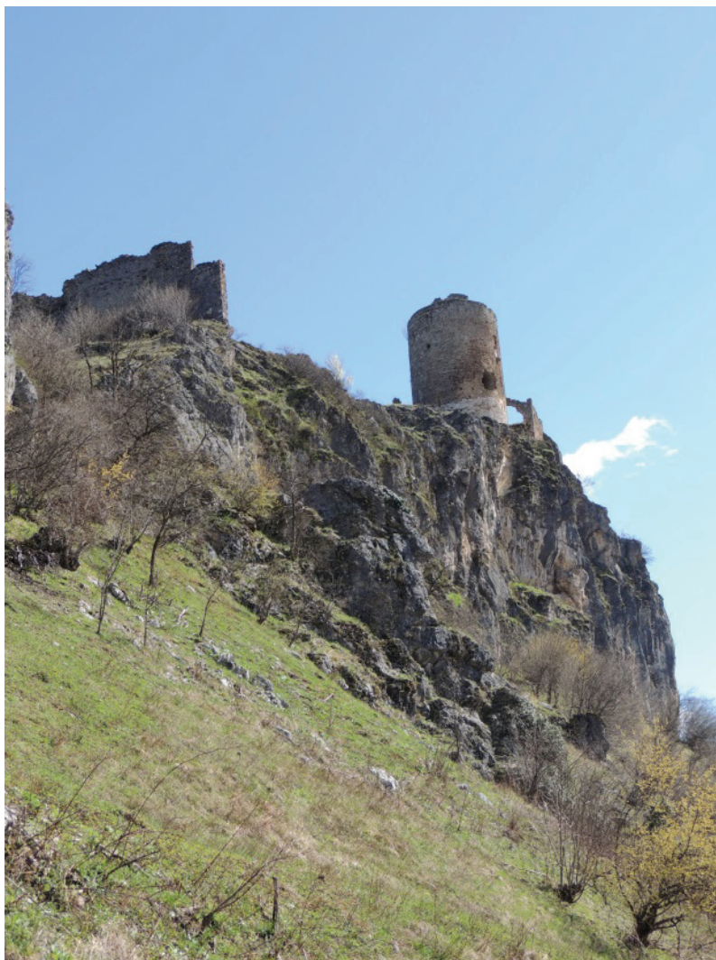
obr. 4 Sokolac