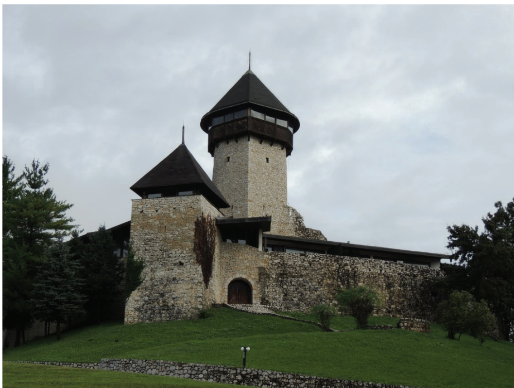
obr. 1 Velika Kladuša