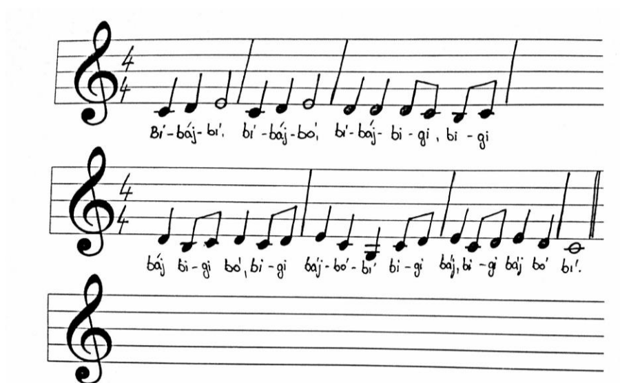
Obrázek 1: noty „Bí báj bí“