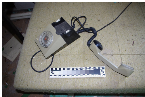
Obrázek 7. Telefon. Kuchyně.

Z elektroniky byly v budově přítomny pouze dva přístroje: vytáček telefon (Obr. 7) a televizor Diamant Tesla Multiservis 2313, jež se vyráběl v Rumunsku od roku 1985 (Diamant Tesla...). Oba se nacházejí v kuchyni.