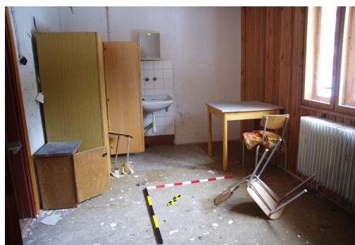
Obrázek 3. Ukáзка fotografické dokumentace jednotlivých místností. Pokoj č. 16.

Druhá fáze výzkumu byla soustředěna především na tvorbu podpůrné dokumentace objektu. Přesněji se jedná o vytvoření rozměrově odpovídajících půdorysných schémat všech podlaží budovy (Obr. 2) a zjištění rozměrů základních artefaktů, které se v prostoru nacházejí opakovaně (movité vybavení ubytovacích pokojů). Tento krok výzkumu lze nazvat jako přípravná fáze zjišťování distribuce artefaktů.