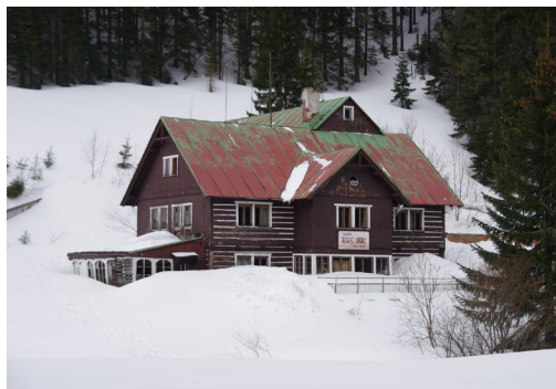
Obrázek 1. Pustá rekreační chata Jelení louky. Pohled od severozápadu.

Rekreační chata Jelení louky (dříve náležící národnímu podniku ČSAD) se nachází 2,5 km severozápadně od centra Pece pod Sněžkou v oblasti podléhající ochraně Krkonošského národního parku (Obr. 1). Odlesněný prostor nesusící společně s chatou shodné jméno byl ještě před rokem 1989 využíván dvěma rekreačními objekty (ČSAD a ČKD) a jednou zemědělskou usedlostí. Původní funkci si však do dnešního dne udržela pouze bývalá chata ČKD, která je nyní v soukromých rukou. Oblast, kde je situován zkoumaný objekt, tedy nelze charakterizovat jako opuštěnou, ale naopak celoročně obývanou. Poloha objektu nedaleko jednoho z nejrůšnějších turistických center, a zároveň situování v oblasti prakticky nedostupné silniční dopravě, vytvořila unikátní podmínky k dochování tohoto objektu, ale zároveň nebezpečí jeho zničení či přetvoření v rámci nové lukrativní výstavby. Dokumentace a provedení výzkumu této lokality se tedy staly neodkladnými.