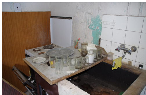
Obrázek 6. Nádobí na odkapávači vedle dřezu. Kuchyně.

Mezi ostatní výbavu rekreačního objektu můžeme zařadit nádobí, jež se bez většího překvapení nachází výhradně v kuchyni. Jmenovitě se jedná o skleničky, keramické hrnečky, plastovou mísu, naběračku a dvě plechové pokličky odložené na odkapávači vedle dřezu (Obr. 6). Ostatní typy nádobí byly zastoupeny porcelánovými talíři a smaltovými hrnci uloženými v kredenci.