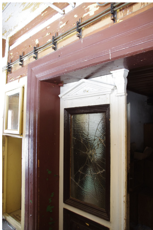
Obrázek 5. Klasicistní dveře původního vstupu do chaty. Vnější strana.

Také vnitřní uspořádání chaty ilustruje její stavební vývoj. Přízemí budovy odpovídá klasicistní dispozici trojdílného vesnického domu se dvěma trakty. V době před ukončením užívání objektu se zde nacházela kuchyň, jídelna, dílna, sklad prádla, tři místnosti s čistě komunikační funkcí, obytný pokoj č. 3 a koupelna sloužící zřejmě provozovatelům objektu. V původní síňové části je přístup do mladší stavební fáze, kde nalezneme sprchy, toalety a další koupelnu. Rizalit tvoří v přízemí samostatnou místnost, která sloužila jako sklad dokumentů. Zde také nalezneme výše zmiňované klasicistní dveře, jež (ačkoliv představují stavebně nejhodnotnější prvek chaty) byly pozdější přestavbou uvězněny do druhořadé místnosti na konci komunikačních tras.