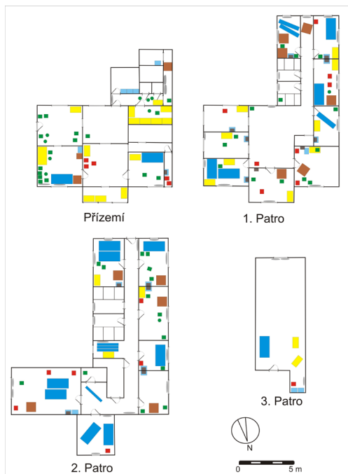
Obrázek 4. Schéma rozmístění standardizovaného nábytku. Tmavě modře – postel (zúžený obdélník – postel povalená na bok), světle modře – umyvadlo, šedý obdélník – skříňka se zrcadlem, šedý ovál – topení, žlutě – skříň, hnědě – stůl, červeně – noční stolek, zelený čtverec – stojící židle, zelený kruh – povalená židle. Schéma M. Váňa.

kde se také nalézá čelo stavby. Budova chaty se dnes skládá z přízemí, dvou nadzemních pater a podkroví upraveného na obytné místnosti.