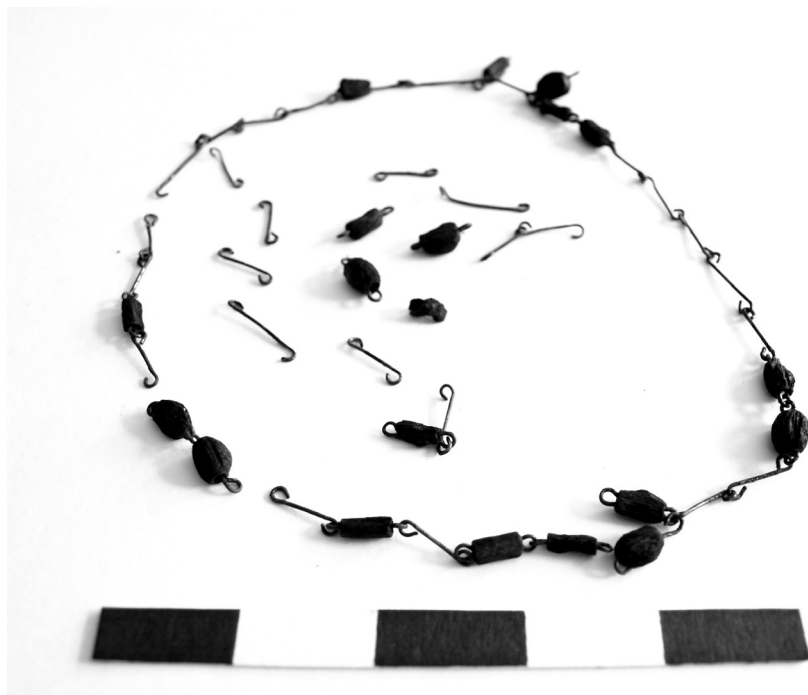
Obr. 1. Zbytky růžence ze hřbitova u kostela sv. Mikuláše v Českých Budějovicích (HANUŠOVÁ, Veronika, 2010, s. 92).