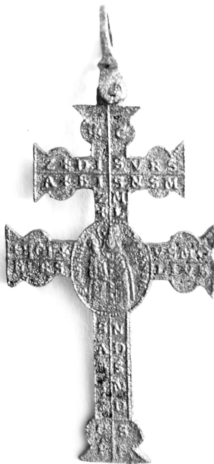
Obr. 3. Kříž Caravaca ze hřbitova u kostela sv. Mikuláše v Českých Budějovicích (HANUŠOVÁ, Veronika, 2010, s. 103).