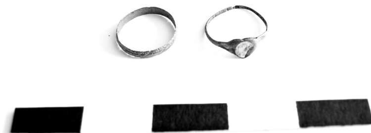
Obr. 4. Prsteny ze hřbitova u kostela sv. Mikuláše v Českých Budějovicích (HANUŠOVÁ, Veronika, 2010, s. 104).