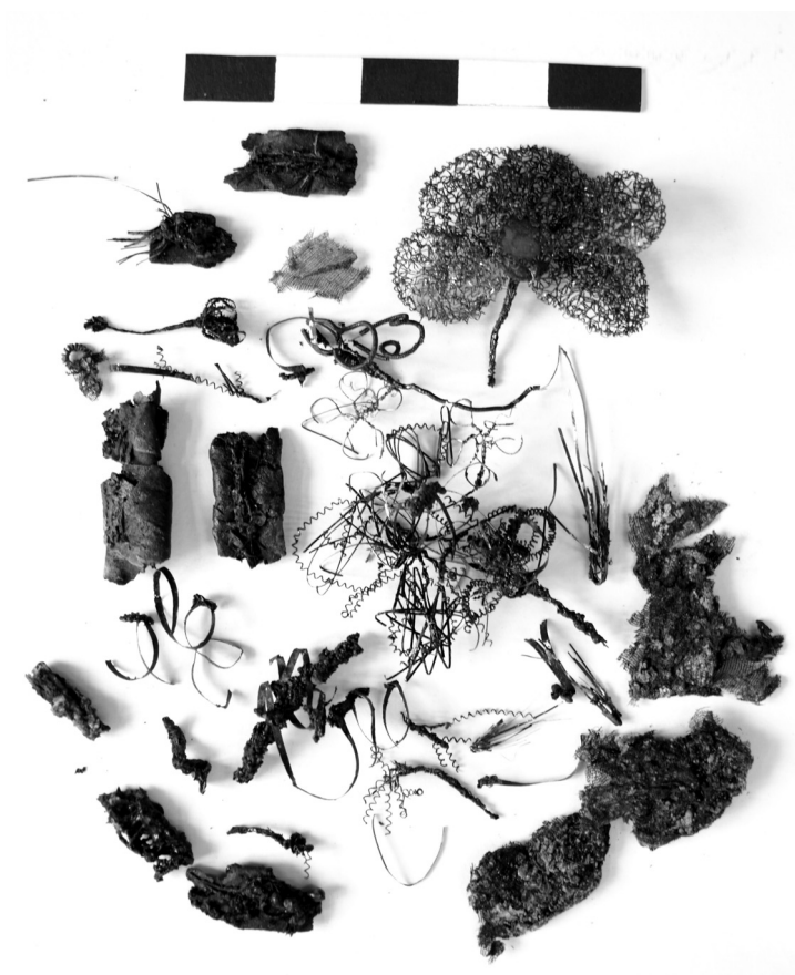
Obr. 5. Zbytek čepce ze hřbitova u kostela sv. Mikuláše v Českých Budějovicích (HANUŠOVÁ, Veronika, 2010, s. 132).