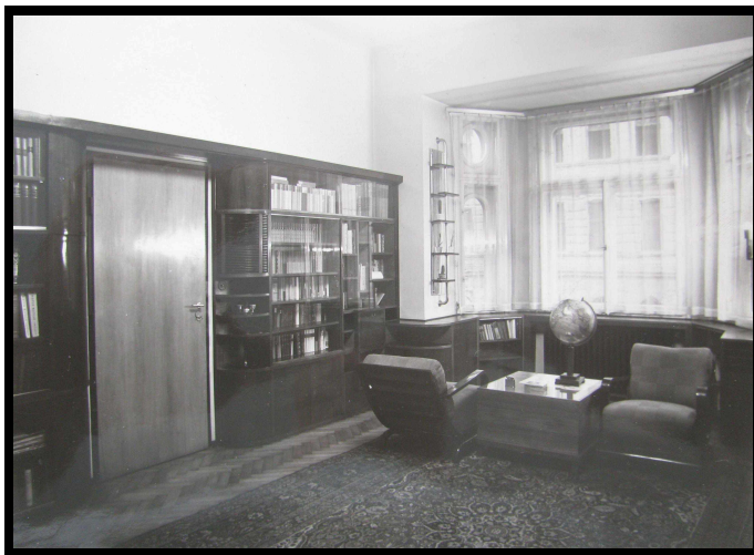
Obr. 7 – Pracovna MUDr. Neumanna v jeho vinohradském bytě.