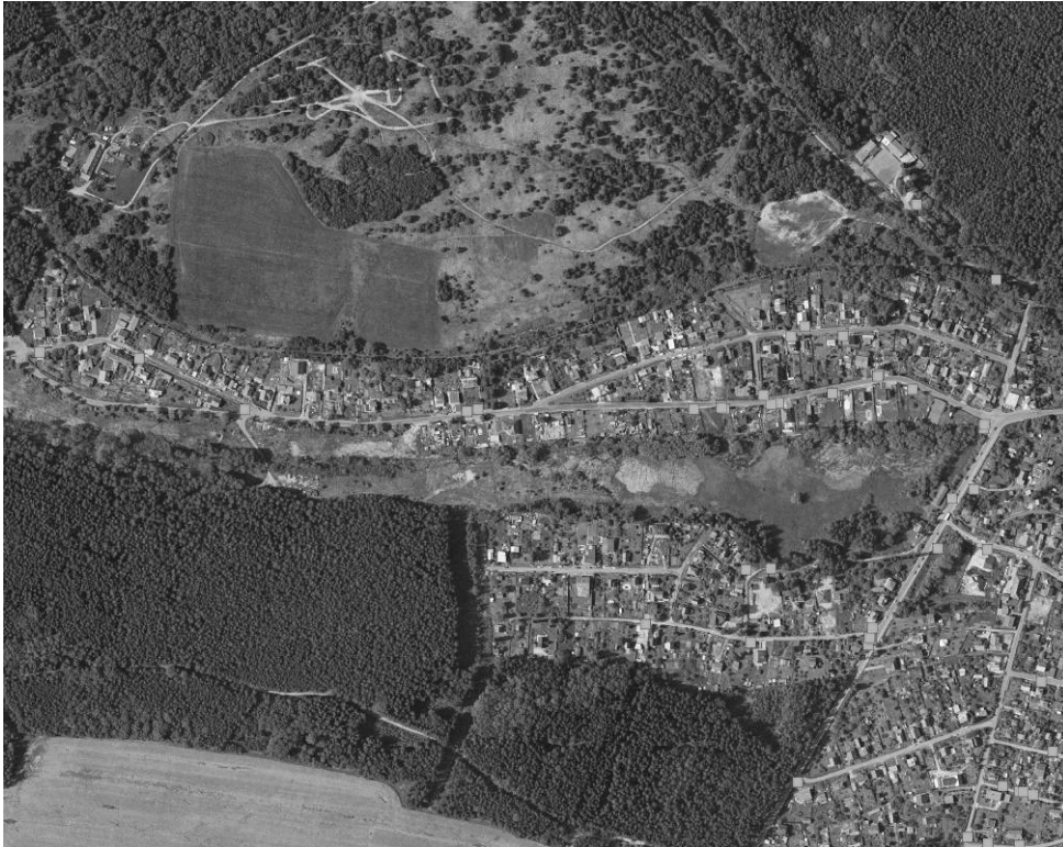
Obr. 2: Mapování invazních rostlin – data pořízená v terénu

a) mapa (pro všechny druhy, je pořízen jeden typ bodového zákresu a zapsány atributy: název taxonu, kvantita výskytu)