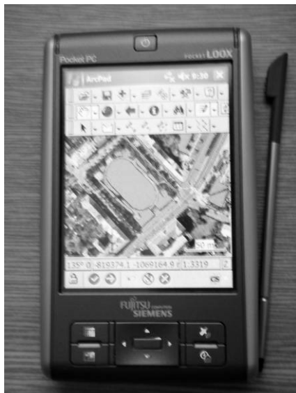
Obr. 1: PDA používané při mapování

Mapování v husté zástavbě ve městě bývá limitováno nepřesnostmi při měření GPS, a proto používáme zakreslování do ortofotomap. Jediným omezením je doba nabití baterie v PDA, která při plném provozu vydrží cca 5,5 hodiny. Metody jsou vhodné i pro mapování ve velkém území, což dokládají výsledky z dvouletého mapování ruderální vegetace města Plzně, které probíhá v rámci řešení projektu GAČR: Vliv suburbanizace na druhové složení městské flóry a vegetace na příkladu Plzně od roku 2006.