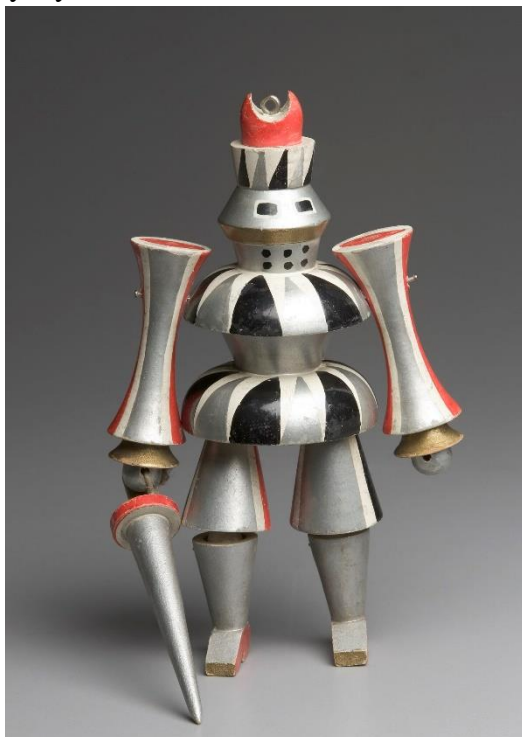
Příloha č. 1: Obrázek loutky Rytíře, 1924

UPM, Uměleckoprůmyslové museum v Praze [foto]. 14.12.2018 – 30.03.2019. In: Ladislav Sutnar: Loutky a hračky [online]. [Cit. 12.8.2023]. Dostupné z: https://www.upm.cz/ladislav-sutnar-loutky-a-hracky/