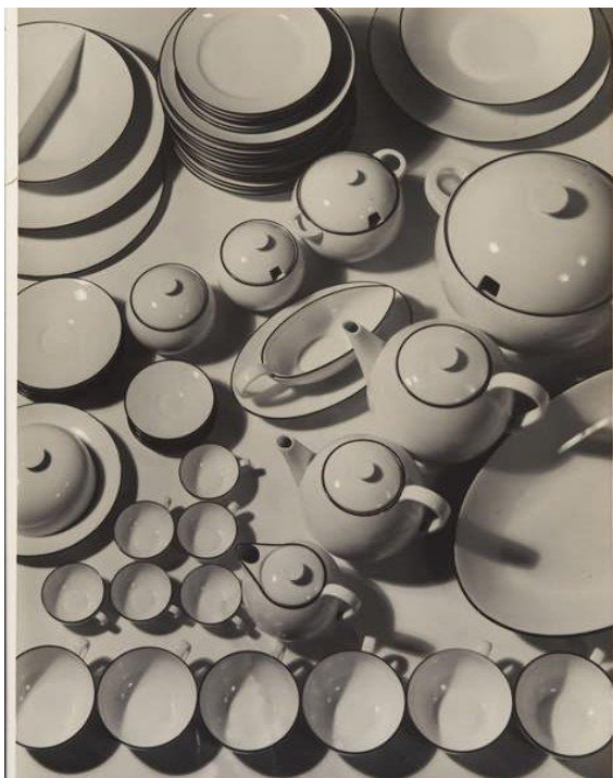
Příloha č. 2: Obrázek Sudkovy reklamní fotografie, 1936

CZECHDESIGN.CZ [foto]. 19. 12. 2006. In: Družstevní práce: Sutnar – Sudek [online]. [Cit. 11.8.2023]. Dostupné z: https://www.czechdesign.cz/temata-a-rubriky/druzstevni-prace-sutnar-sudek