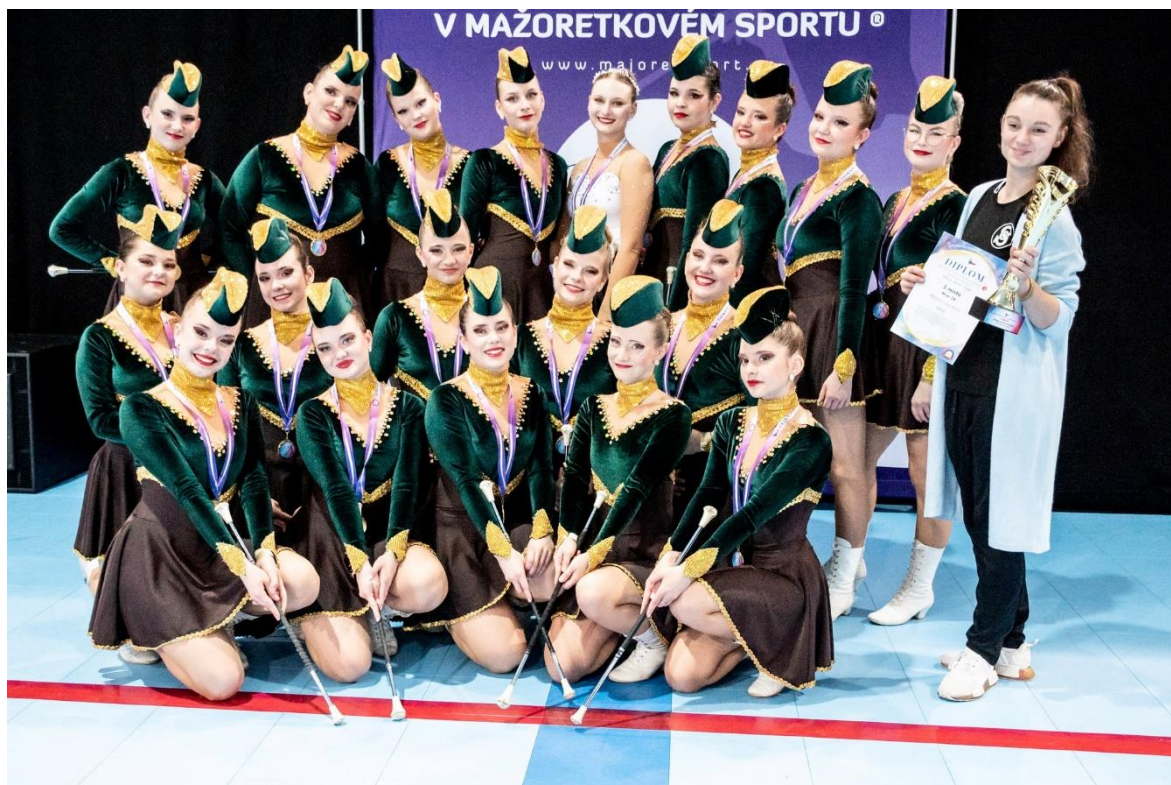
Příloha 7: Mažoretky Prezioso.