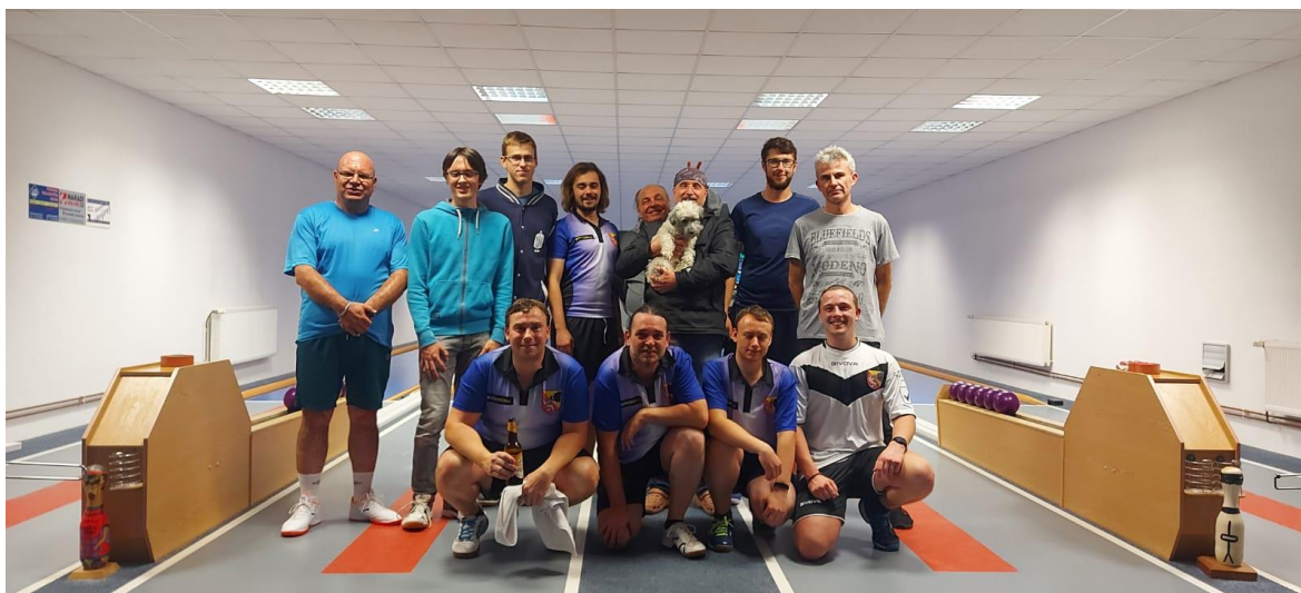
Příloha 12: A a C tým, přátelské utkání.