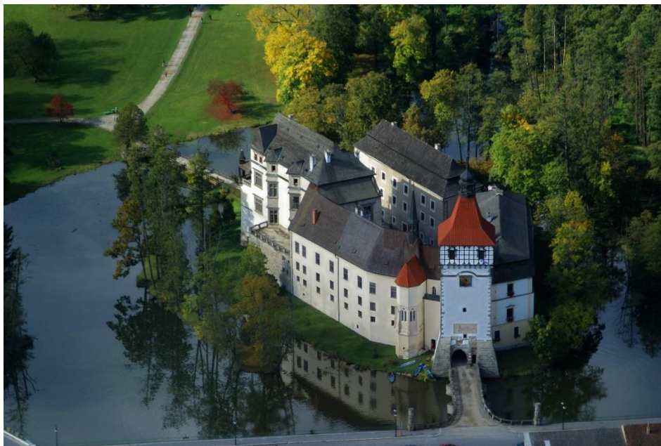
Příloha 1: Blatenský vodní zámek.