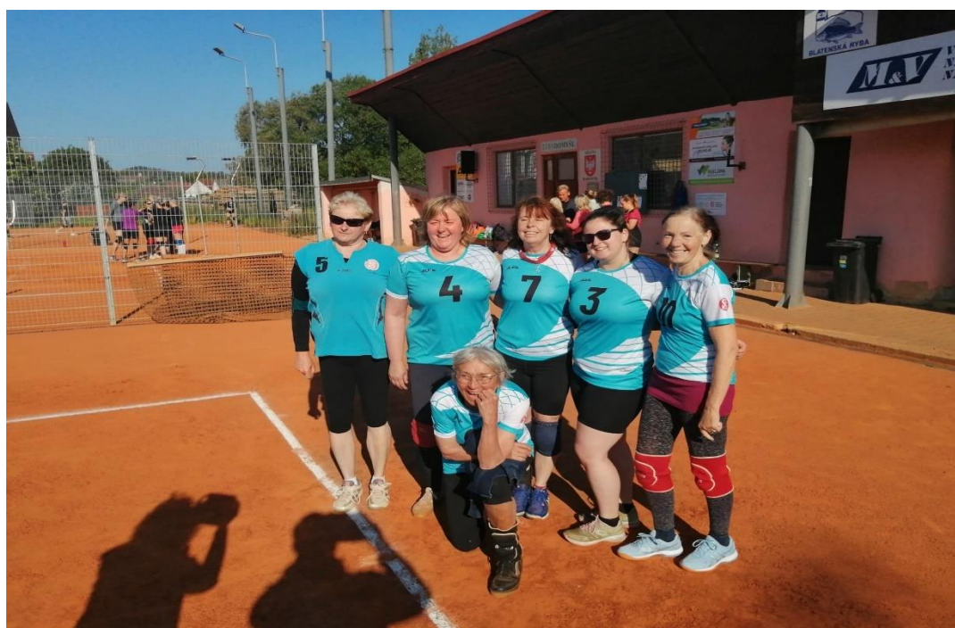
Příloha 8: Volejbalový tým žen. Zdroj: Blanka Malinová, starostka jednoty.

https://www.facebook.com/photo/?fbid=709468121189448&set=pb.100063787981175.-2207520000.&locale=cs_CZ