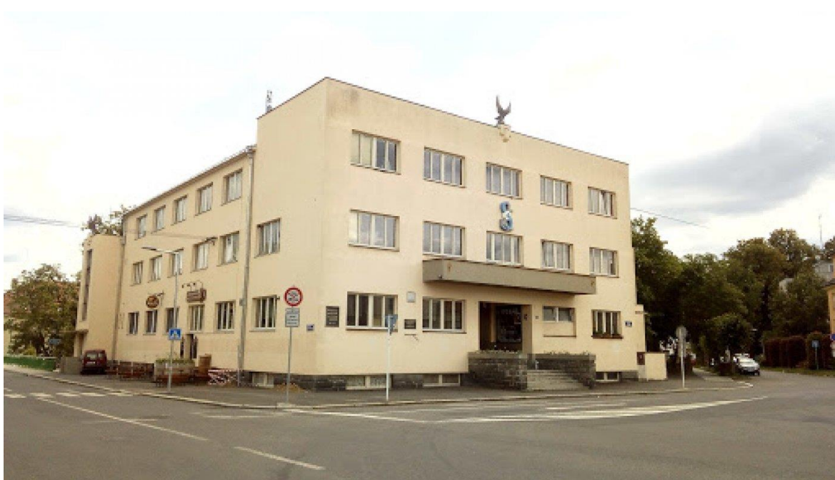
Příloha 5: Blatenská sokolovna.