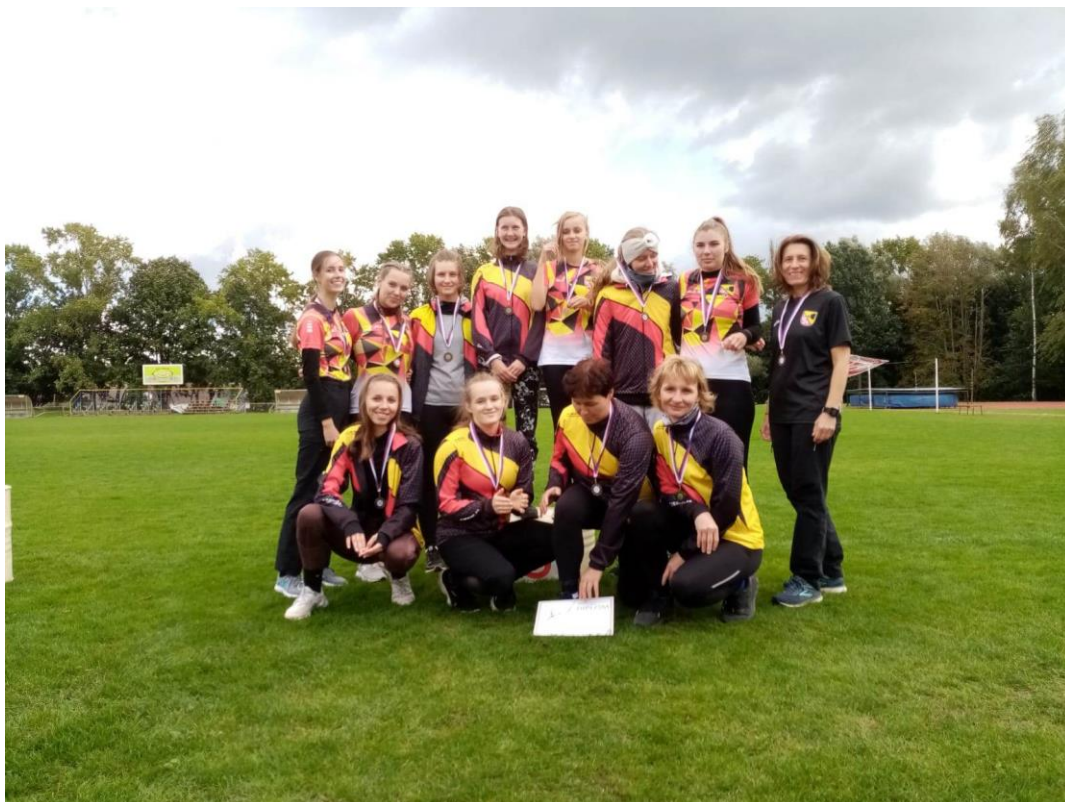
Příloha 9: Ženský tým atletiky.