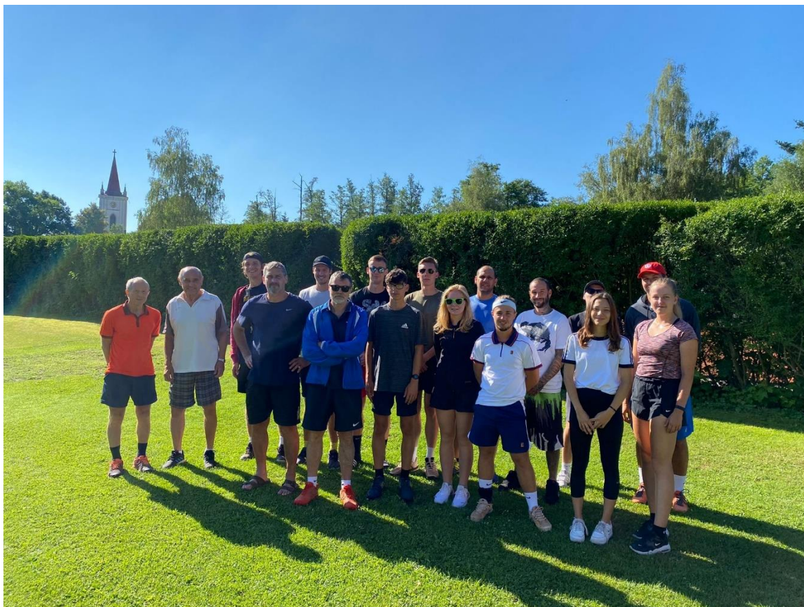
Příloha 12: Oddíl tenisu, turnaj „Blatná OPEN“ 2022.