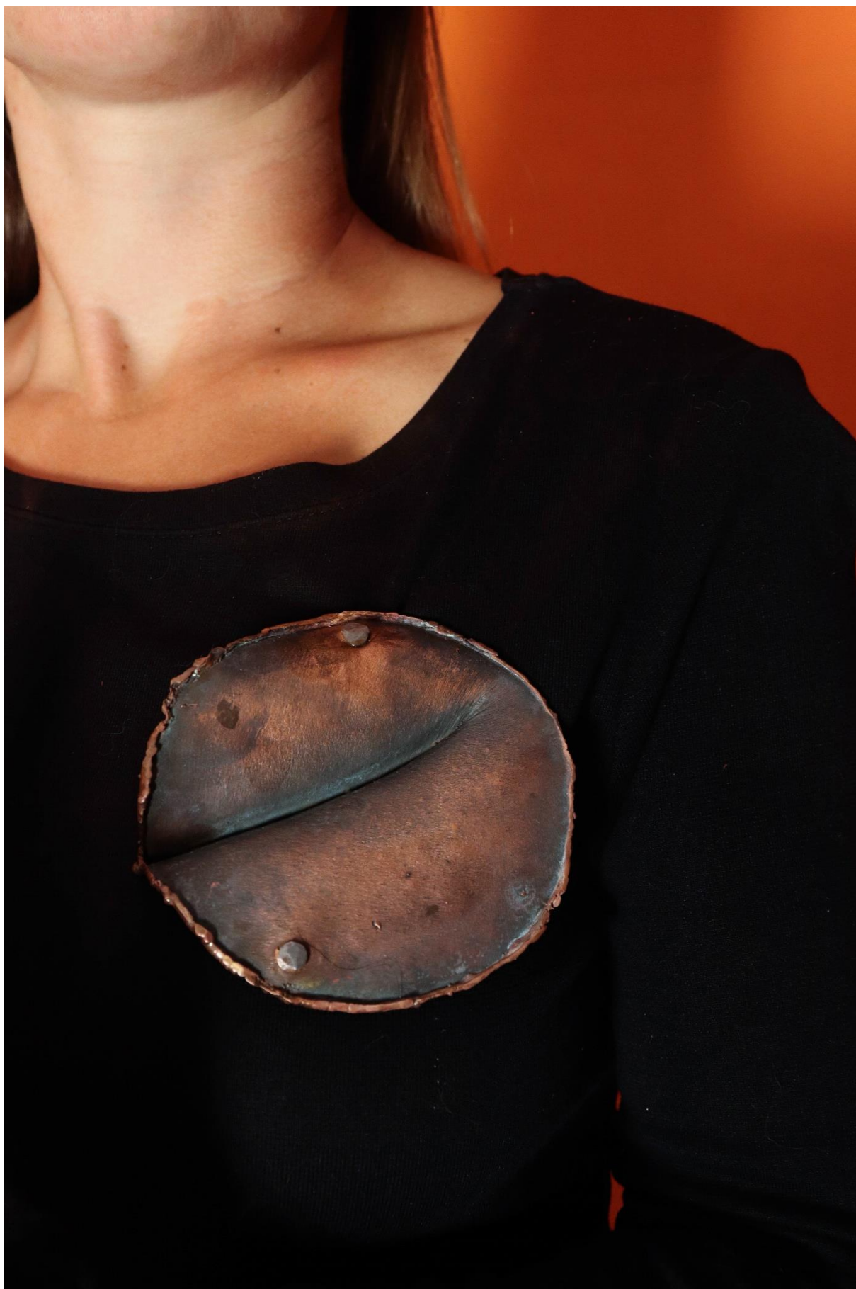
příloha 25 Himba