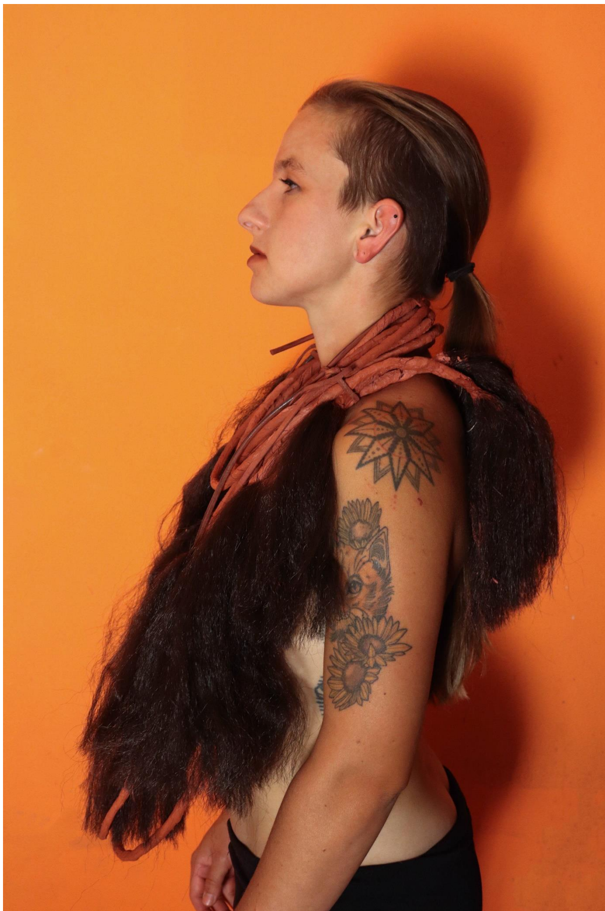
příloha 29 Himba