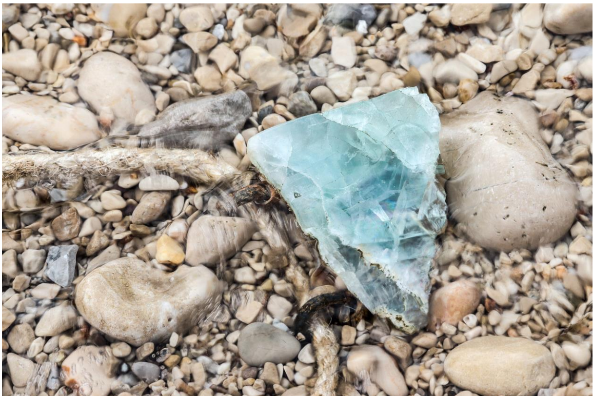
příloha 6,7 hlubina