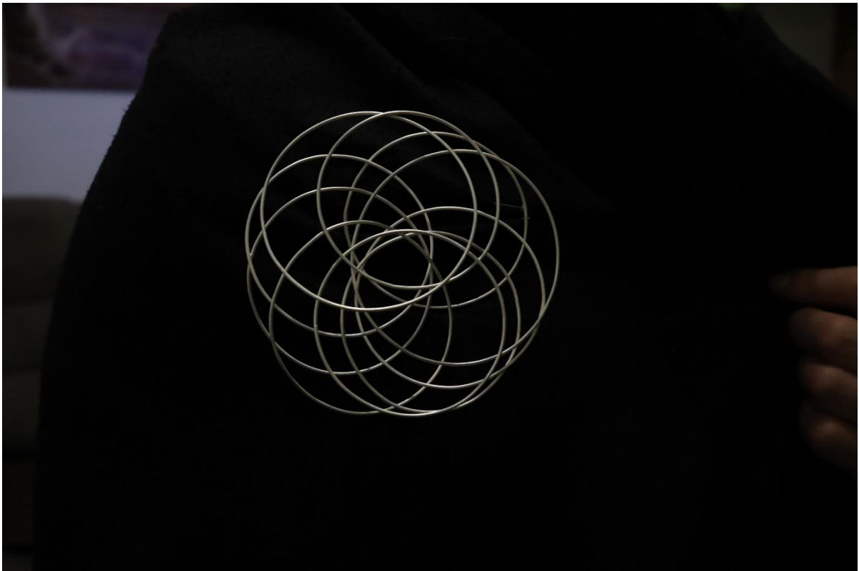
příloha 11,12 Santini