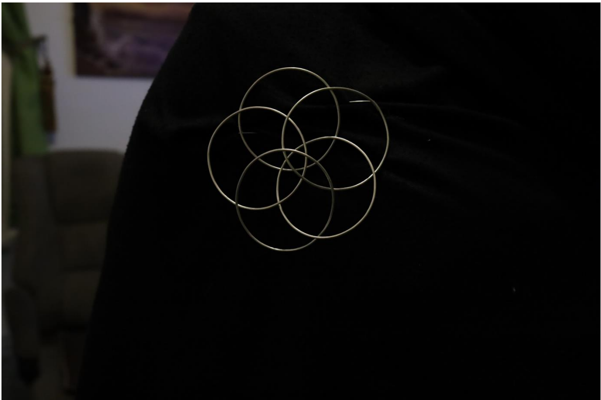
příloha 13,14 Santini