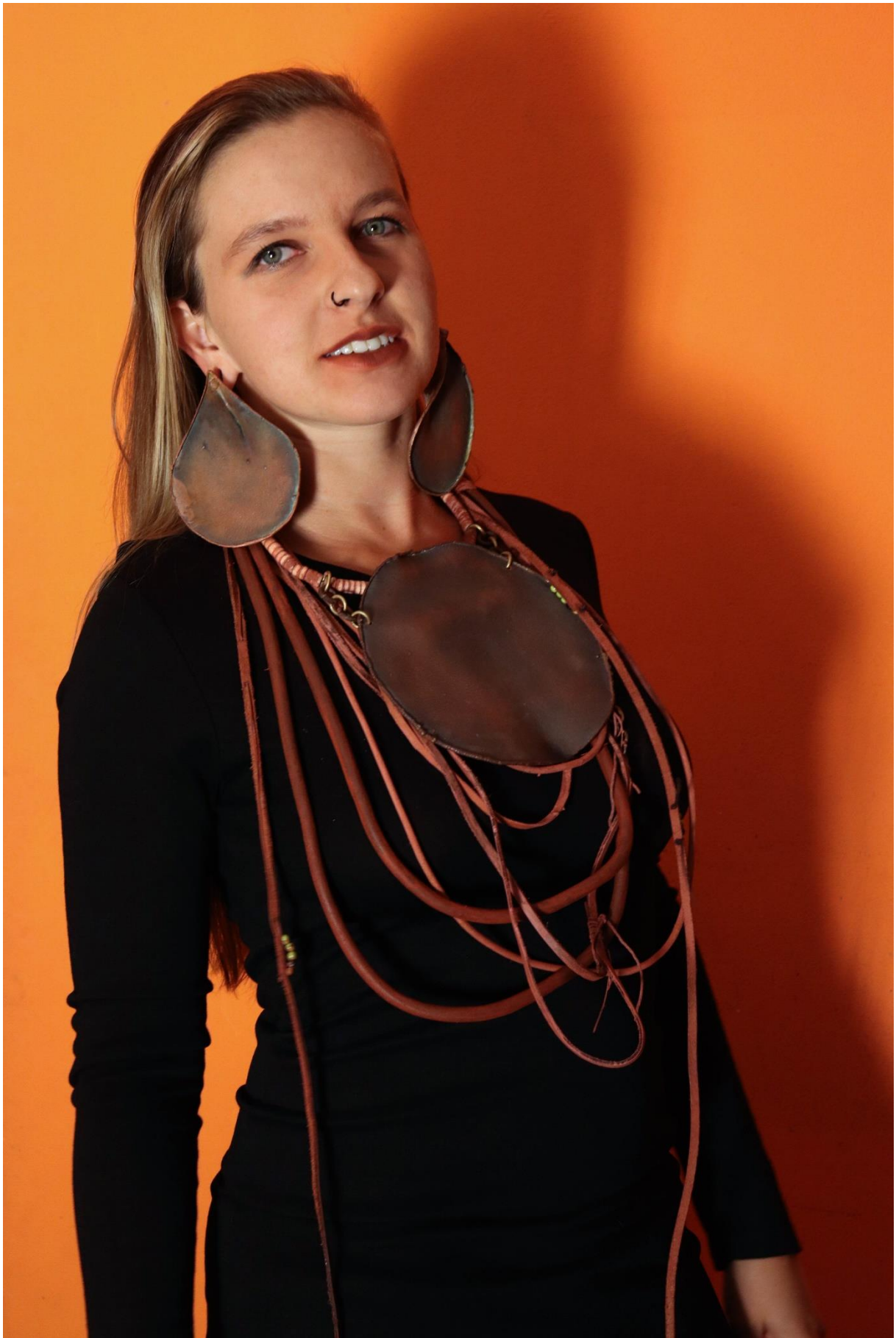
příloha 19 Himba