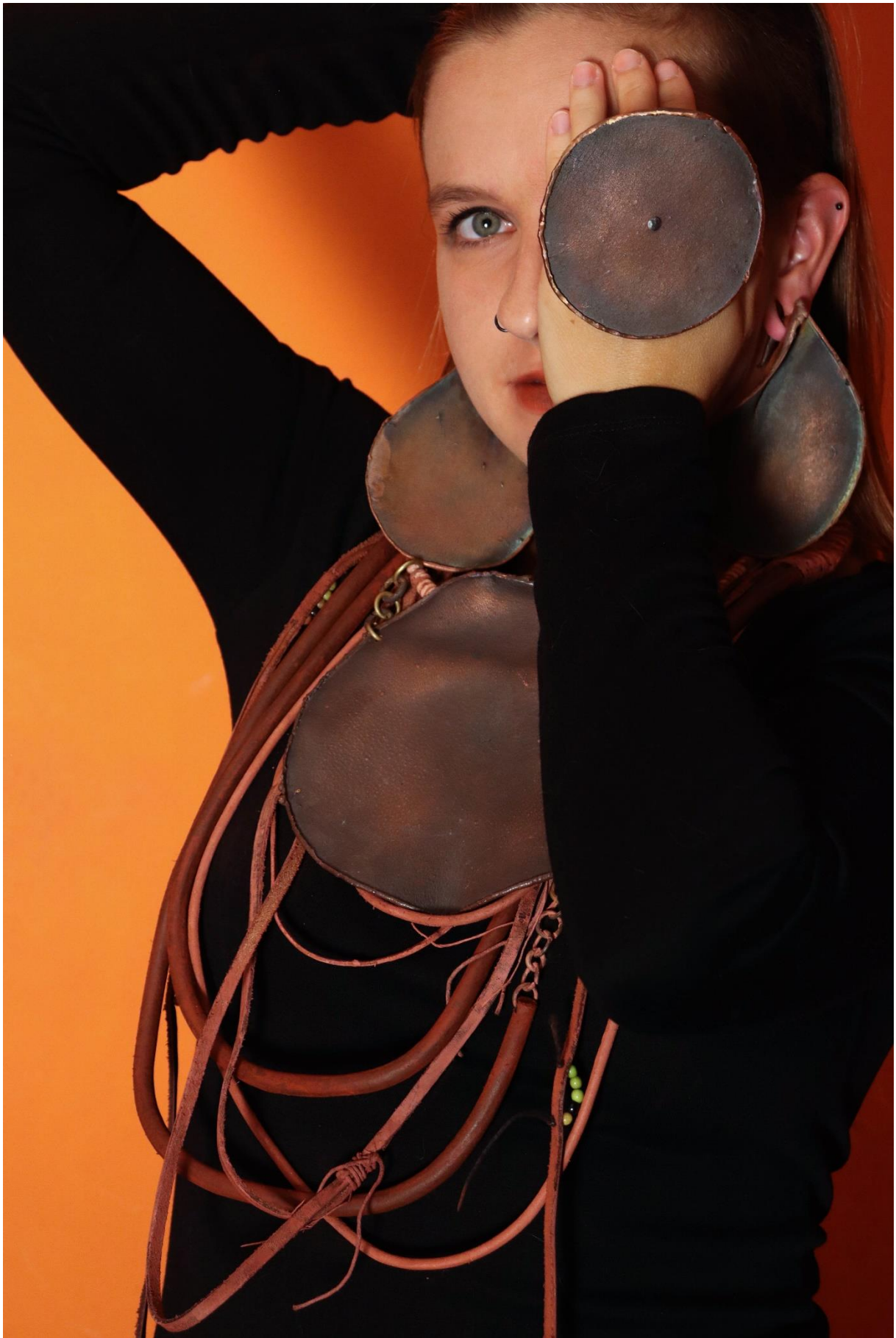
příloha 18 Himba