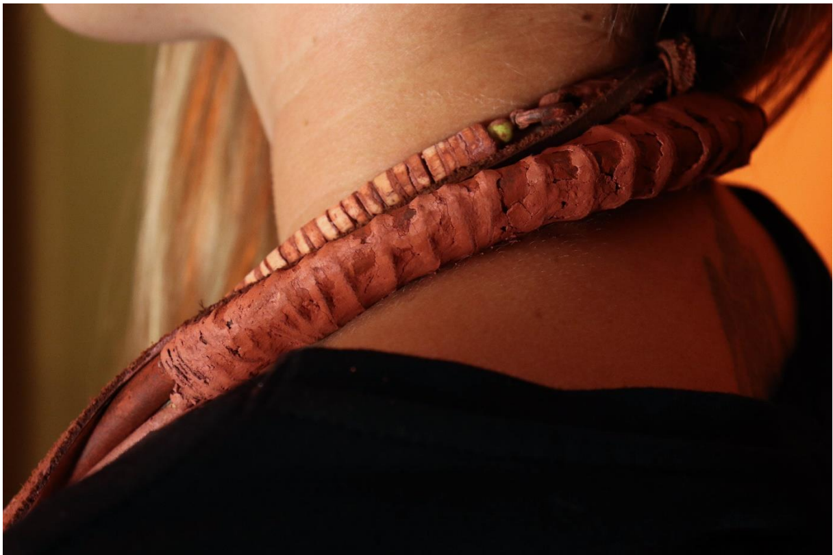
příloha 21,22 Himba