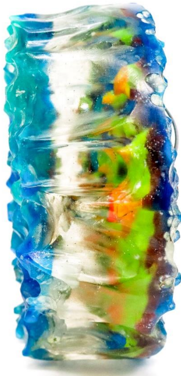
příloha 3,4 plíseň