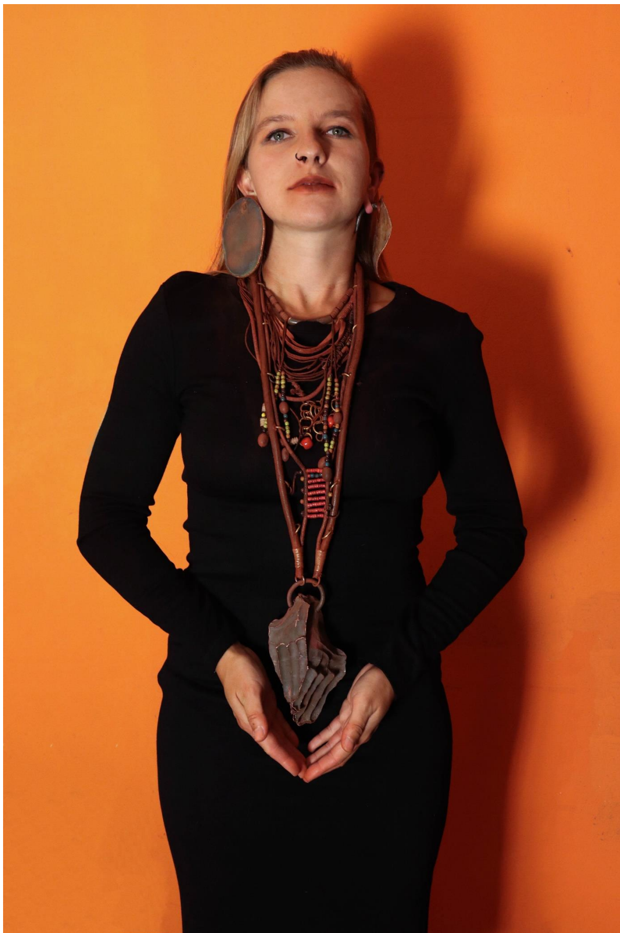
příloha 26 Himba