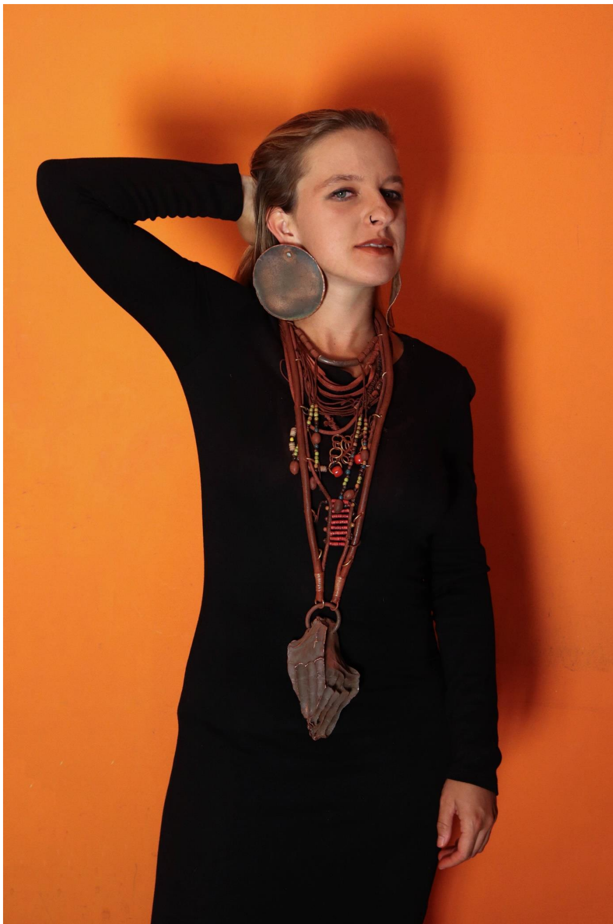
příloha 27 Himba