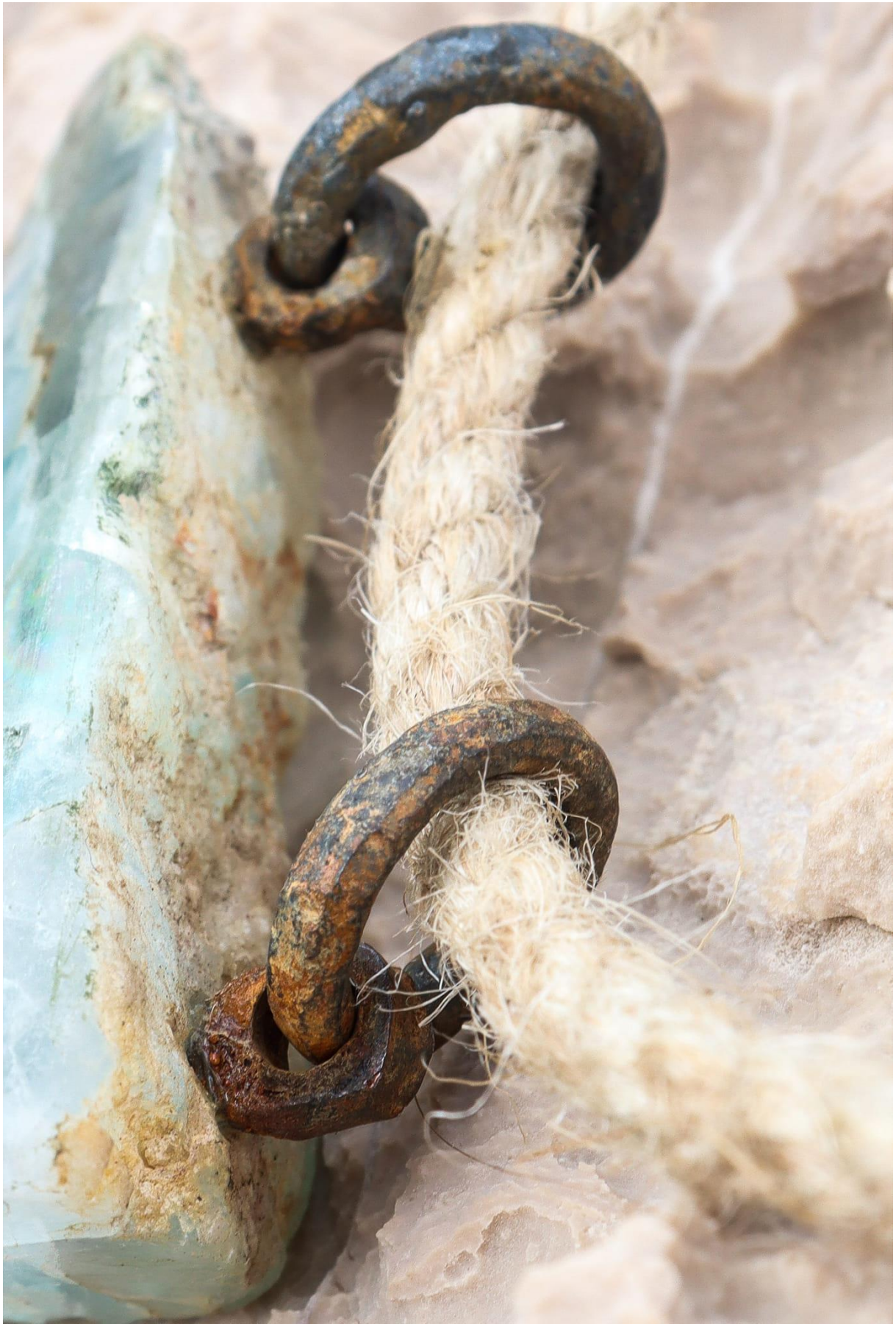
příloha 8 hlubina