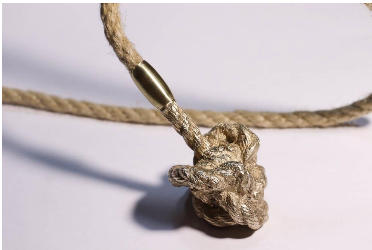
Příloha 1,2 pečetní prsten