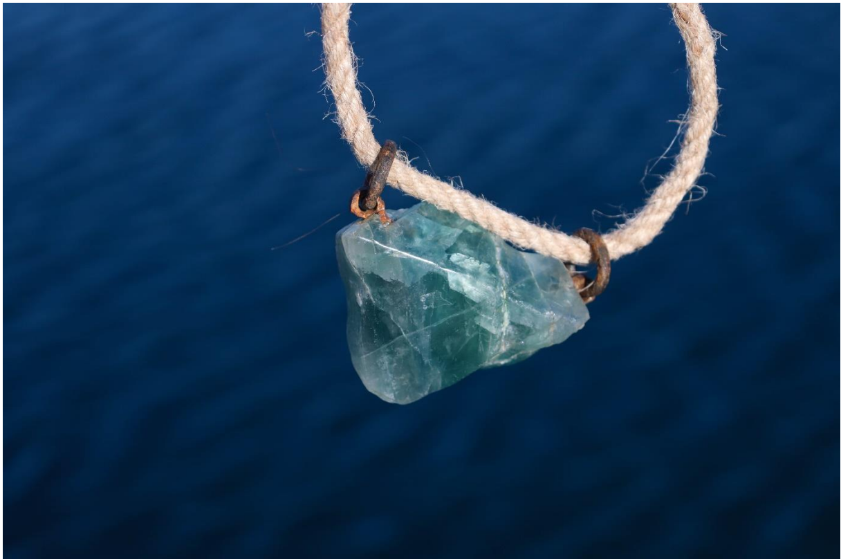
příloha 9,10 hlubina