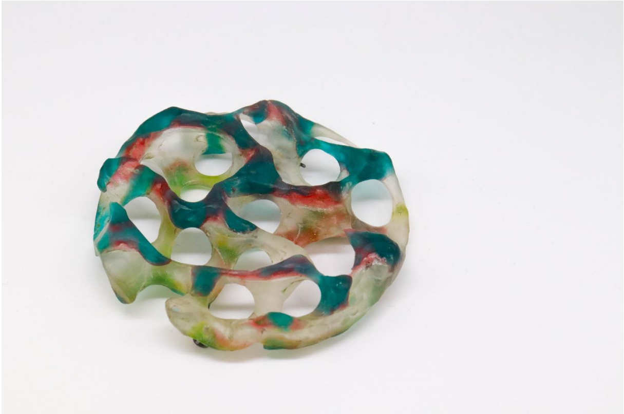
příloha 5 plíseň