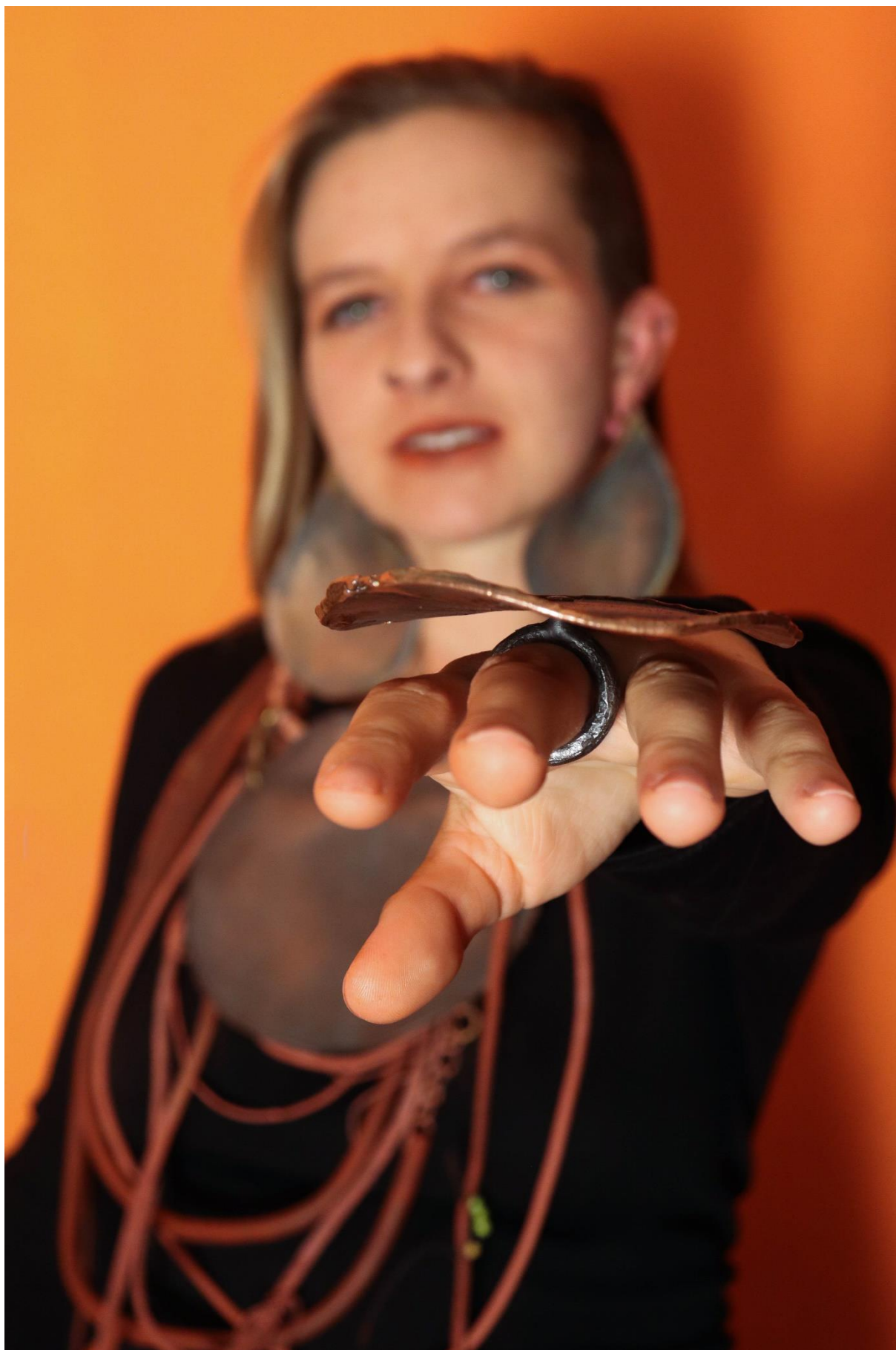
příloha 20 Himba