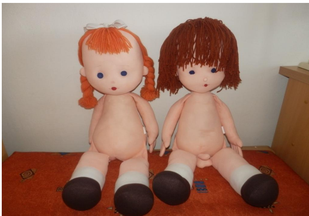
Pomůcky „Jája a Pája“ bez oděvu.