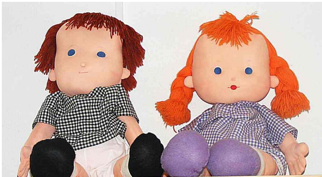
Pomůcky pro výslech dětských svědků „Jája a Pája.“