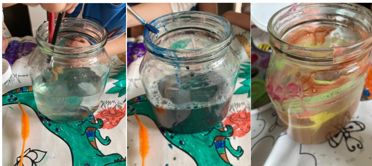
Obrázek 10 Experimentování s barvami

V hudební pohádce Jak se žralok Albert poučil byly příběhem a jeho zhudebněním více zaujaty dívky než chlapec. Zatímco při výrobě hudebních nástrojů a pomůcek k pohádce byl více aktivní chlapec než dívky. Aktivita byla složitější z pohledu techniky, proto se domnívám, že chlapec se zaměřením na mechanické hračky se při výrobě těchto pomůcek cítil komfortněji.