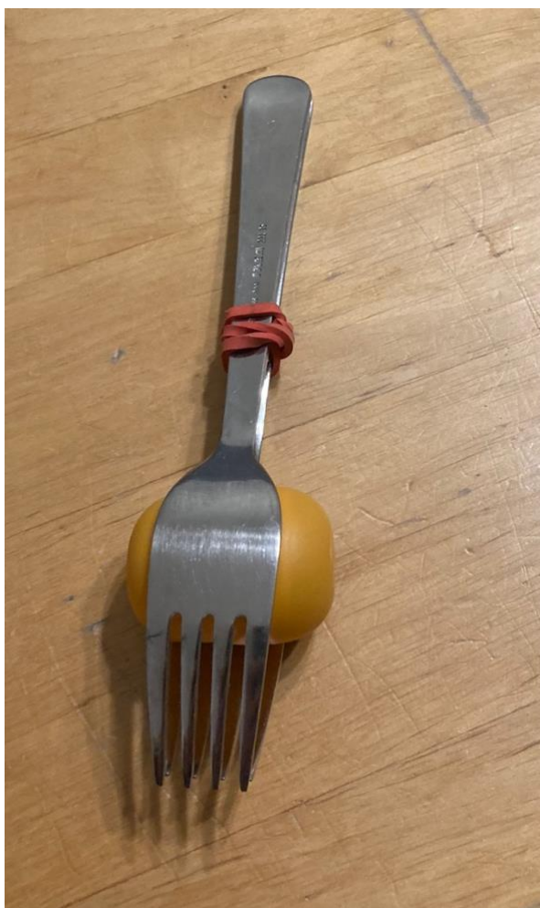
Obrázek 2 Zhotovený hudební nástroj (chrastítko) – svrchu

Pracovní postup: Nejprve otevřeme obal od Kinder vajíčka, který naplníme materiály dle výběru dítěte. Dále do 2 plastových polévkových lžic vložíme naplněný plastový obal. Jednoduší postup je, že si jednu z těchto lžic položíme na stůl a následně na ní položíme obal Kinder vajíčka (naplněný), které si přikryjeme druhou lžicí. Tím máme základ chrastítka hotový. Co nejlíže k vajíčku protáhneme gumičku přes 2 lžice. Poté chrastítko zdvihneme a oblepíme barevnou páskou. Každé dítě má volný výběr barev, pásku může pokreslit, nejen aby si ho poznalo, ale taktéž vytvoří unikátní vzor. Finální výrobek je na obrázku č. 2 a 3.