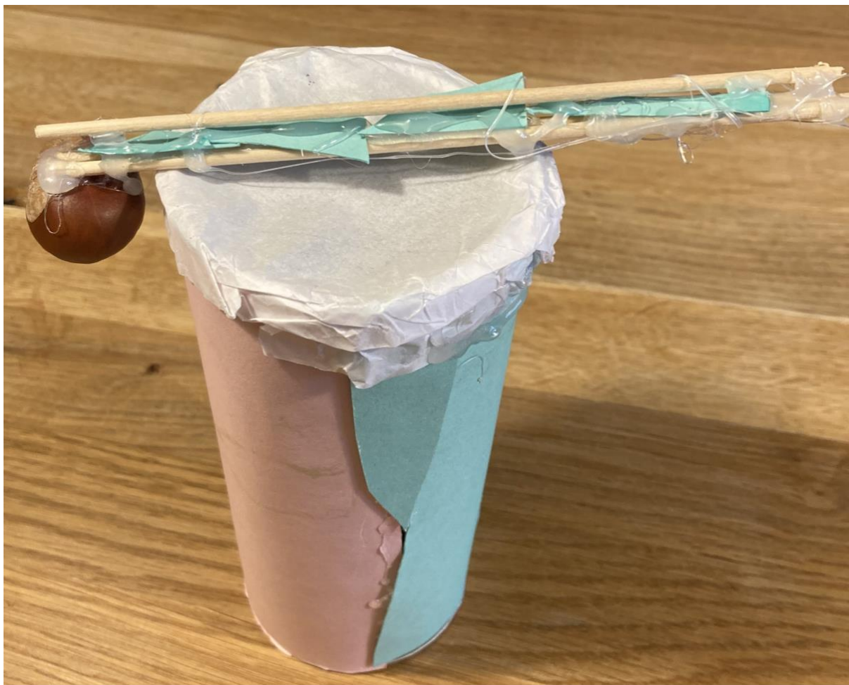
Obrázek 1 Zhotovený hudební nástroj (bubínek)