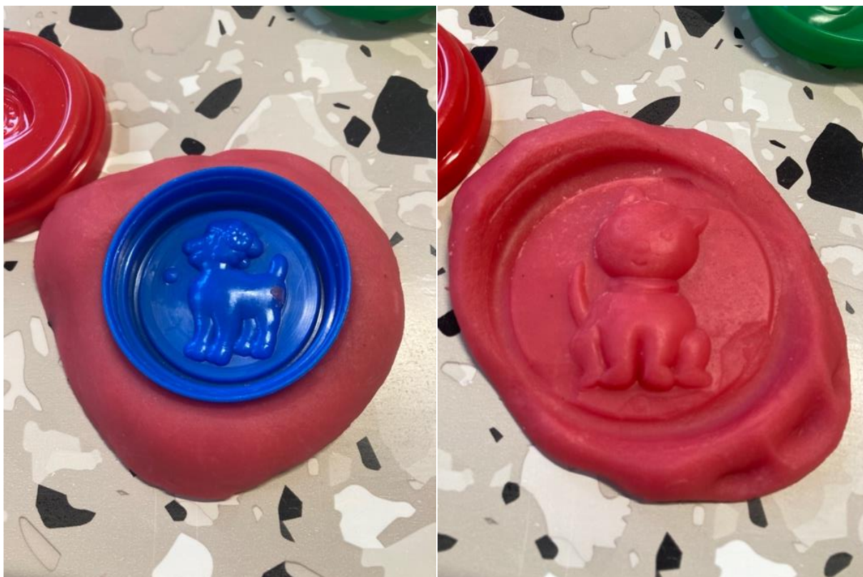
Obrázek 13 Obtisklé tvary v modelíně