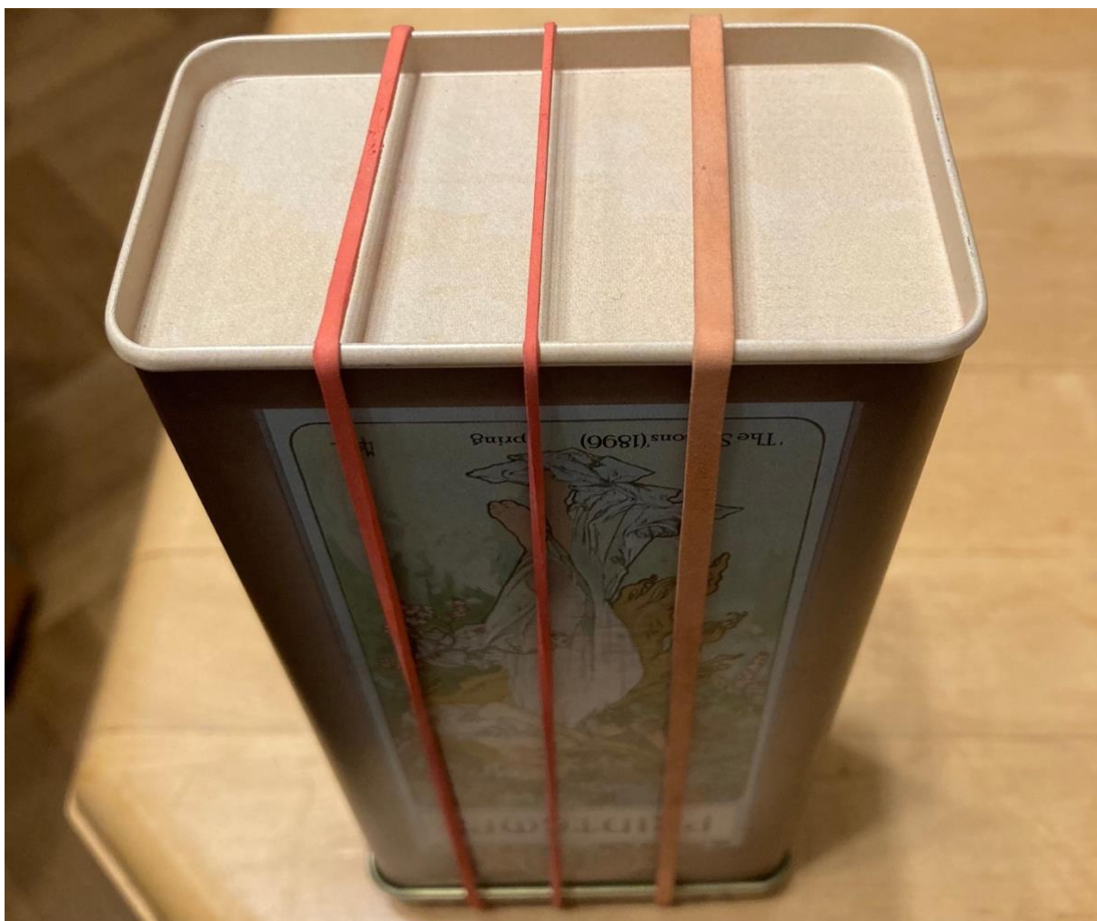
Obrázek 7 Zhotovený hudební nástroj (strunný nástroj)