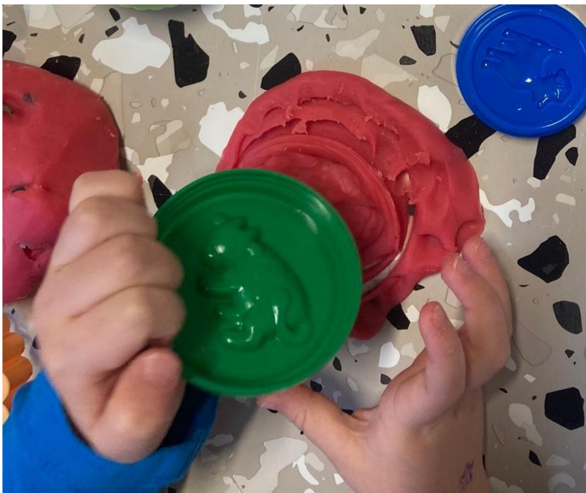
Obrázek 12 Obtiskování do modelíny

Pracovní postup: Vezmeme si vykrajovátka se zvířátky, které se v písni objevují v pořadí kráva, kočka a pesek. Píseň si s dětmi zpíváme, a přitom děti vykrajují zmíněné zvířátko v dané sloce. Jednotlivé sloky zpíváme postupně za sebou, tak aby děti dostaly dostatečný čas na výrobu. Obtiskování vykrajovátek je na obrázku č. 12 a 13.