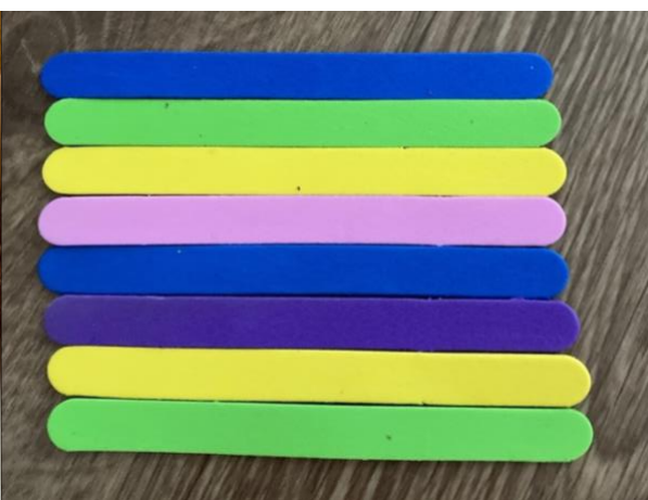
Obrázek 6 Zhotovený hudební nástroj (xylofon) – svrchu