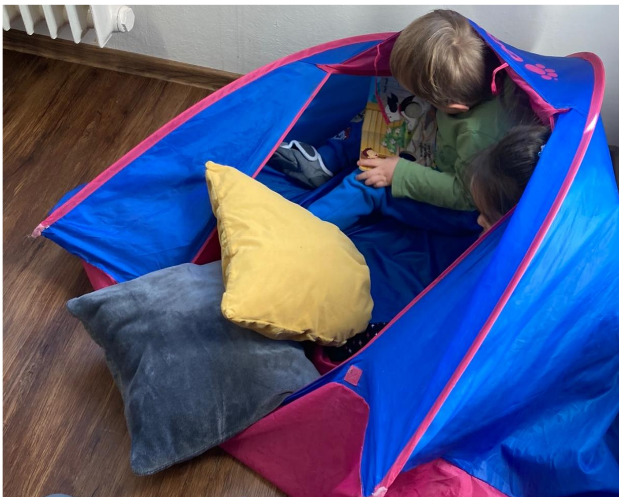
Obrázek 14 Děti v dračím doupěti (sloka Draci, Draci)