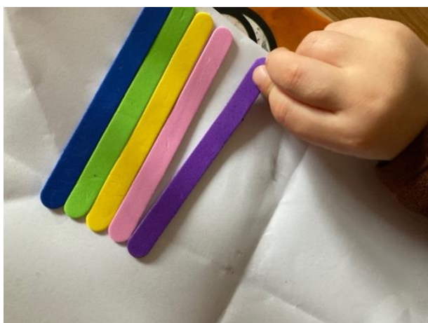
Obrázek 5 Zhotovený hudební nástroj (xylofon)

Pracovní postup: Vezmeme si dřevěné špachtle, které pokládáme jednu vedle druhé. Děti vedeme ke kreativitě, mohou tak použít různě barevné dřevěné špachtle, nebo si je mohou samy obarvit dle jejich výběru. Počet jednotlivých kláves můžeme rovněž nechat na dětech, nebo můžeme výrobu xylofonu využít k předmatematické představivosti dětí, kde jim zadáme počet kláves, které má xylofon mít případně mohou dané klávesy spočítat. Dle zručnosti dítěte můžeme ukládání špachtlí zjednodušit jejich lepením lepidla např. na papír. Finální výrobek je na obrázku č. 5 a 6.