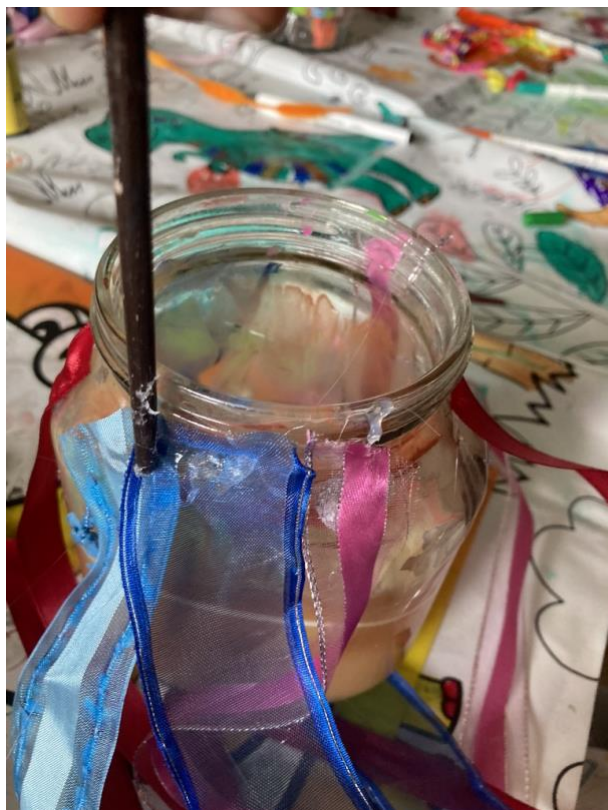
Obrázek 8 Výroba chobotnice s chapadly

Z chobotničky můžeme vytvořit i chrastítko, tím že do poháru vložíme kamínky, skleněné kuličky, „céčka“ a podobně (Obrázek č. 9). Chobotnička tak při převrácení vydává zvuk.