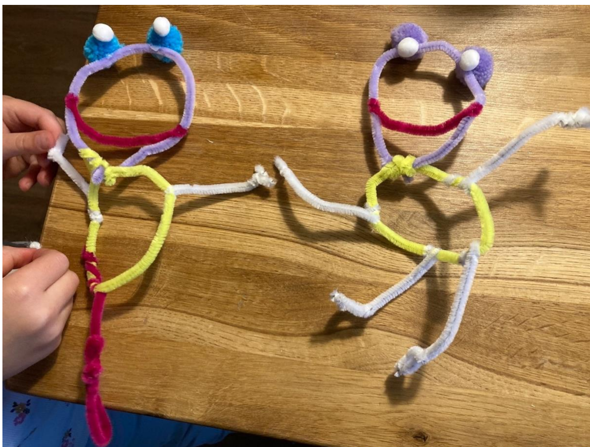
Obrázek 4 Zhotovený hlavní postavy

Pracovní postup: Nejprve použijeme chlupaté drátky, dle výběru postav z příběhu (volný výběr). Děti necháme, ať z drátků vytvarují postavy. Dětem pomáháme s úpravou délky drátků pomocí kleští. Tavnou pistoli používáme v případě lepení bambulí, které můžeme využít jako oči. Taktéž rolničky můžeme připevnit nakonec končetin. Motivujeme děti příběhem a neomezujeme je ve tvorbě. Finální výrobek je na obrázku č. 4.