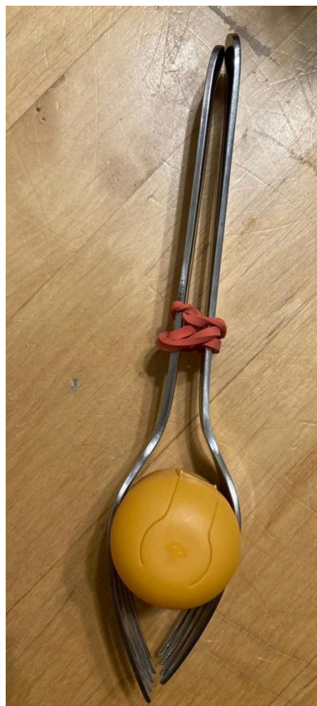
Obrázek 3 Zhotovený hudební nástroj (chrastítko) – ze strany