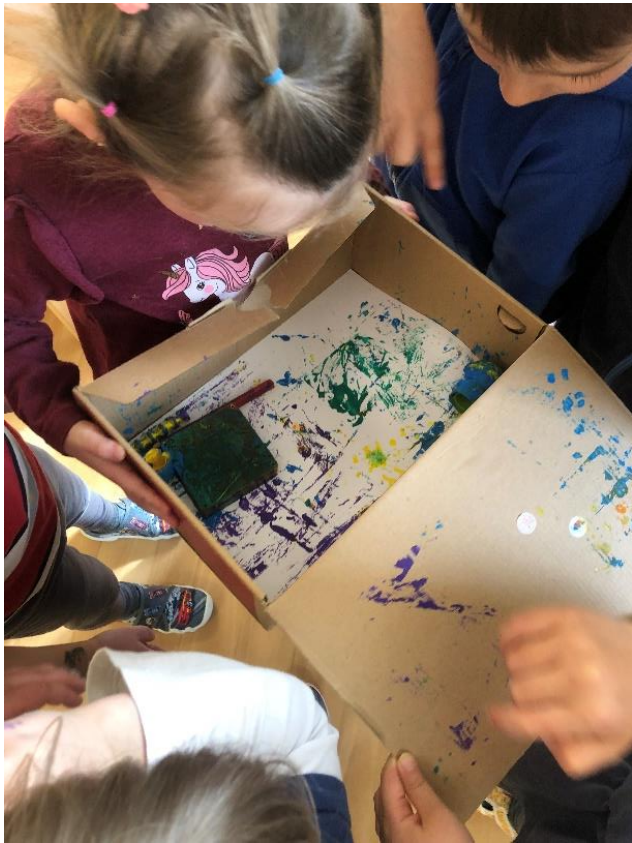
Obrázek 11 – S čím si spolu rádi hrajeme