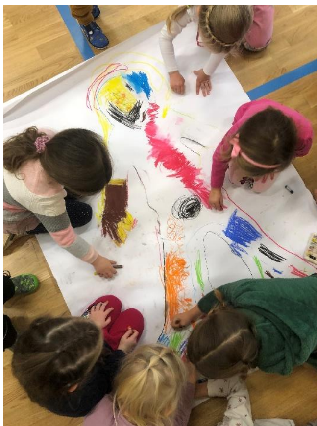
Obrázek 7 - Kresba společného kamaráda, výtvar