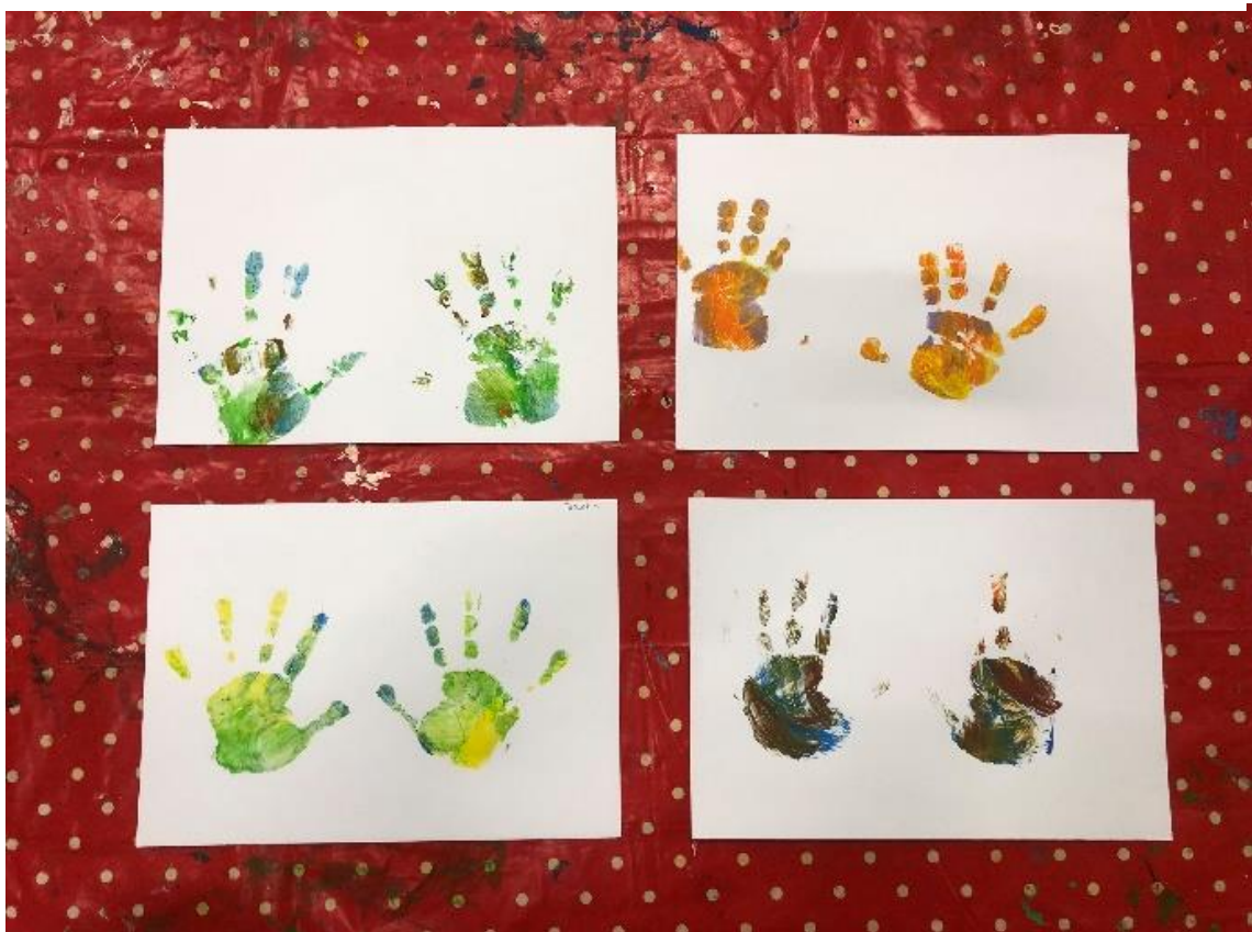
Obrázek 3 – Já a moji kamarádi, výtvary