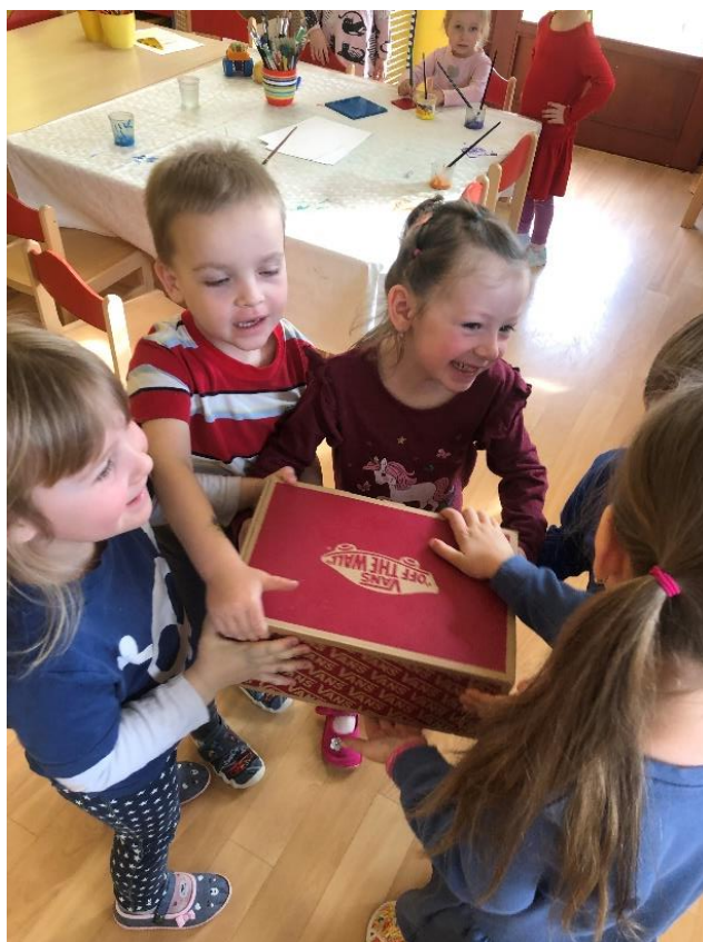
Obrázek 10 – S čím si spolu rádi hrajeme, průběh