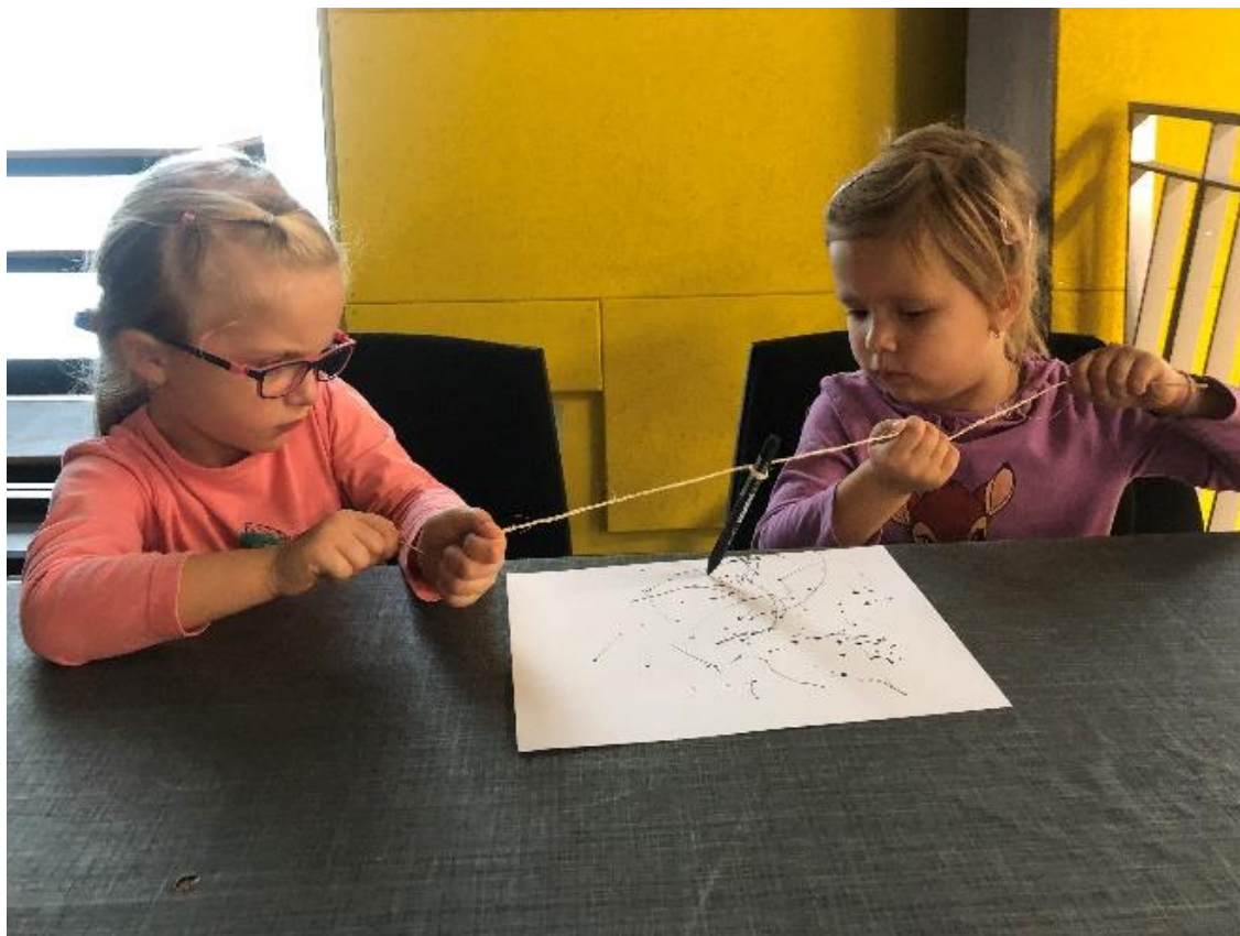
Obrázek 4 – Taháme spolu za jedno lano, průběh

důležitý aspekt empatie. Při této aktivitě musí děti spolupracovat a najít způsob, jak sdílet tužku, aby mohly vytvořit společný obrázek. Toto sdílení může pomoci dětem rozvíjet vědomí o potřebách druhých lidí a vědomí o tom, jak mohou pomoci ostatním. Při poslední části aktivity, kdy jsem se ptala dětí na reflektivní otázky, děti mohly získat zpětnou vazbu a uznání od druhého, což může posílit jejich sebevědomí a sebeúctu.