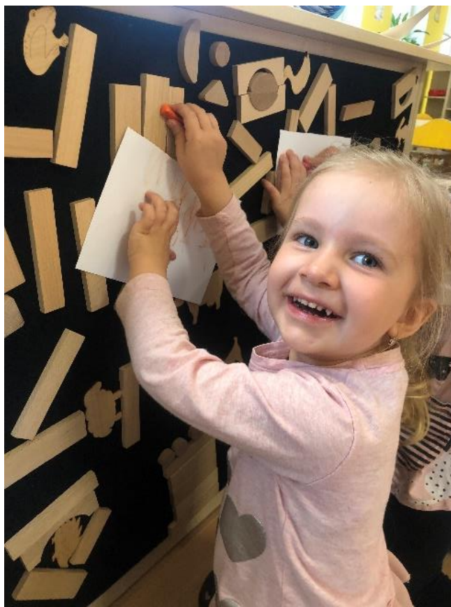
Obrázek 9 - Pavučina kamarádství, frotáž