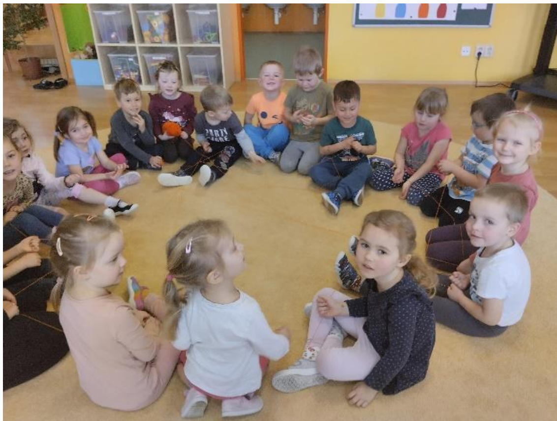
Obrázek 8 - Pavučina kamarádství, průběh

Při této aktivitě se rozvíjelo prosociální chování pomocí spolupráce, kdy děti spolupracují při tvoření pavučiny kamarádství, jelikož bez spolupráce všech by se pavučina rozpadla. Rozvíjela se zde i empatie a porozumění, kdy se děti učily porozumět potřebám a pocitům ostatních, když si přirovnávaly klubíčko ke kamarádství. Tato aktivita mohla pomoci dětem porozumět, jak se cítí jejich kamarádi. U dětí se také rozvíjela komunikace a respekt názoru druhých, jelikož při přirovnávání klubíčka ke kamarádství děti musely promluvit a říct každý svůj názor. Dále při tvorbě pavučiny kamarádství děti musely říct svému kamarádovi, proč je jeho dobrý kamarád. Děti se tak učily vyjadřovat své pocity a myšlenky slovy.