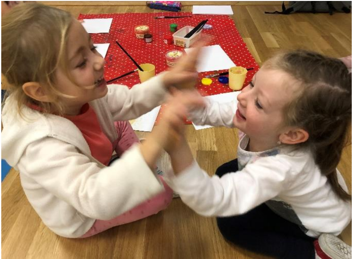
Obrázek 2 – Já a moji kamarádi, průběh