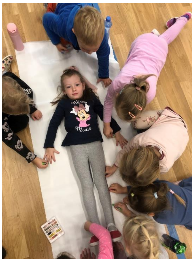
Obrázek 6 – Kresba společného kamaráda, průběh