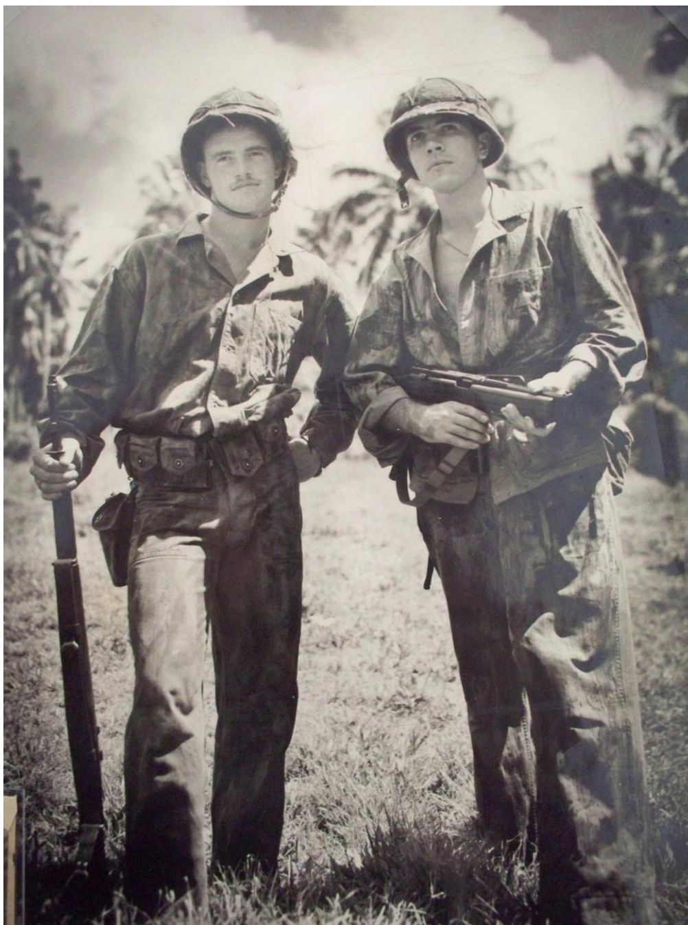
Seržant Michael Strank, vpravo, s neznámým námořním pěšákem. Pravděpodobně na Nové Kaledonii ještě před nasazením na Russelových ostrovech. Za povšimnutí stojí ručně namaskované uniformy obou námořních pěšáků, 1942/43.