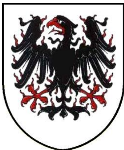
Obr. 6 Svatováclavská plamínková orlice