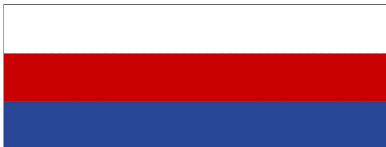
Obr. 8. Státní barvy České republiky