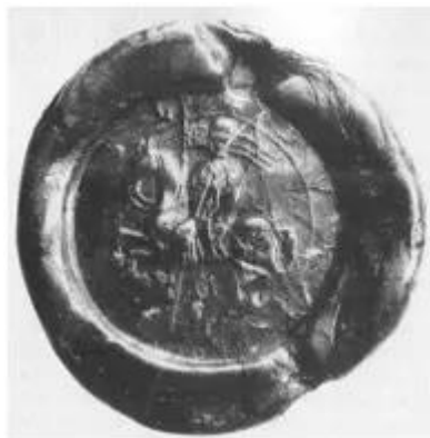
Obr.5 Jezdecká pečeť z roku 1192