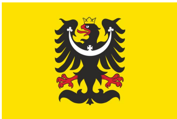
Obr. 3 Slezská orlice