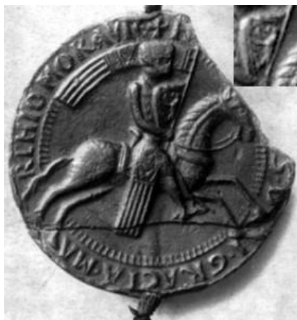
Obr. 7 První doložené vyobrazení českého lva