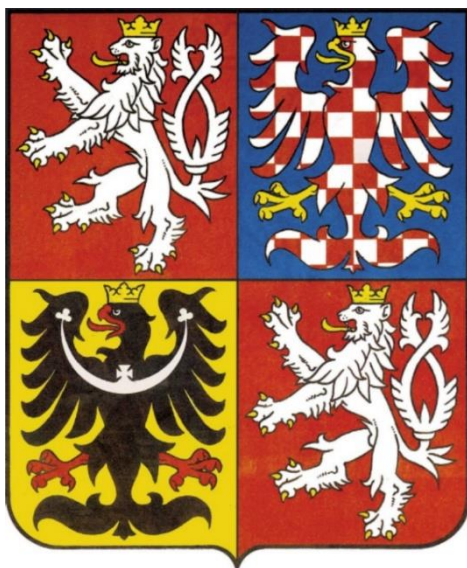
Obr. 4 Velký státní znak