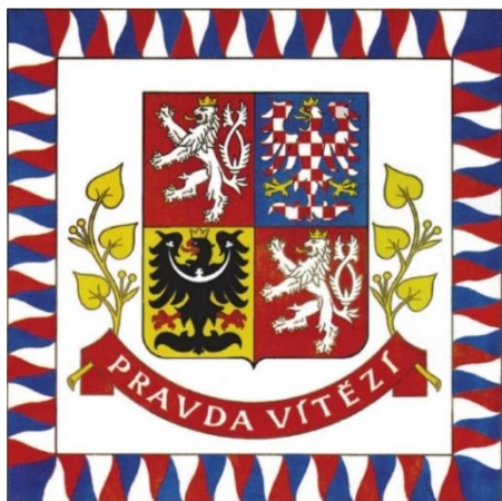
Obr. 10 Prezidentská standarta