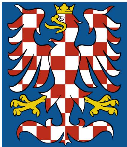
Obr. 2 Moravská orlice