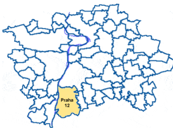
101 Obr.3 městská část Praha 12

Městská část Praha 12 se rozkládá na ploše 2 333 hektarů, její území čítá zhruba 67 tis. obyvatel. Svou rozlohou se Praha 12 řadí mezi čtvrtou největší městské část Prahy. V počtu obyvatel jí patří osmé místo.