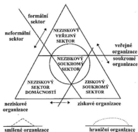
Obr. 2: Sektorové vymezení neziskového sektoru podle Pestoffa 32

základní charakteristiky organizací, které v jednotlivých sektorech NH působí, uvádí Rektořík a kol. (2007, strana 14), viz obrázek pod textem.