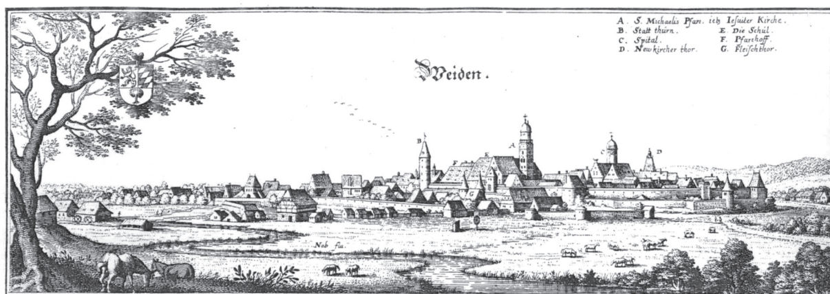
Obr. 4. Město Weiden. Veduta Matthiase Meriana z doby kolem roku 1644. – Abb. 4. Stadt Weiden. Vedute von Matthias Merian aus der Zeit um 1644.