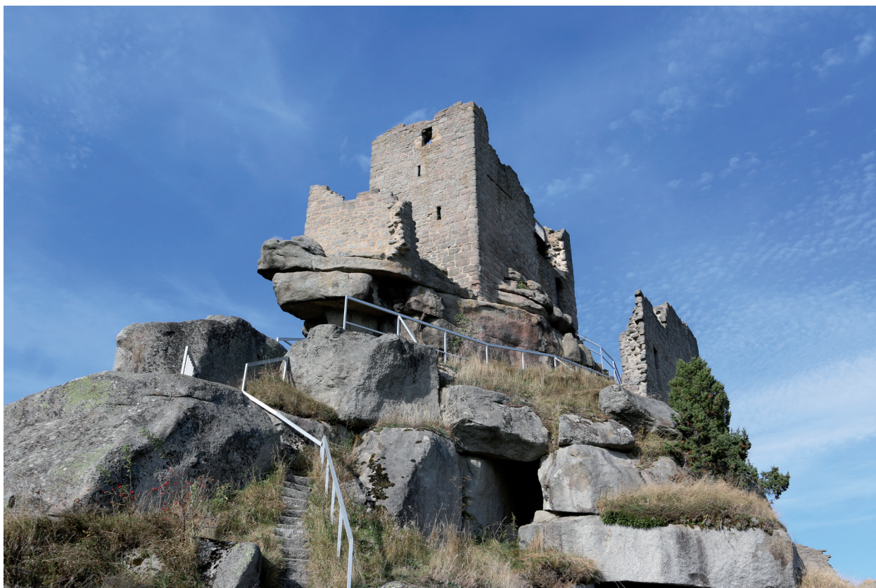
Obr. 1. Hrad Floss v Horní Falci. Jádru hradu od jihu. – Abb. 1. Burg Floss in Oberpfalz. Burgkern, Ansicht von Süden.

v odpovědích kurfiřtů z prosince téhož roku až z února roku následujícího. 7 Po zisku potřebného souhlasu Karel IV. dne 17. dubna 1361 vydává listinu potvrzující tuto směnu (Korunní archiv český, č. 492, 492-493). Poté se již v pramenech Karlswald neobjevuje, a to ani v tzv. „Českém Salbüchleinu“ z roku 1366 (Böhmisches Salbüchlein), nebo později při zástavě české části Horní Falce, což je poněkud překvapující. Nicméně ještě předtím, než se pokusíme přesněji identifikovat Karlswald, je nutné si v krátkosti přiblížit dějiny regionu, kde se tento hrad údajně nacházel.