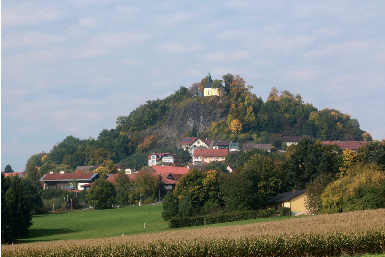
Obr. 2. Hrad Parkstein v Horní Falci. Celkový pohled od jihovýchodu. Foto F. Záruba, 2017. – Abb. 2. Burg Parkstein in Oberpfalz. Gesamtansicht von Südosten. Foto F. Záruba, 2017.

Míšenský, Jindřich a Günter ze Schwarzenburgu, Rudolf z Warty, Konrád z Hoembergu, Fridrich z Waldsee a hejtman Horní Falce, Bušek ml. z Velhartic (RBM VI, č. 855, 534).