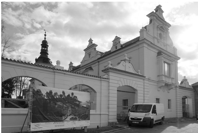
Dnešní podoba zámku ve Vysokém Újezdu.