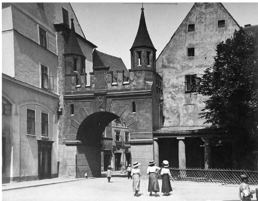
Horní brána v Chebu (kolem r. 1900).