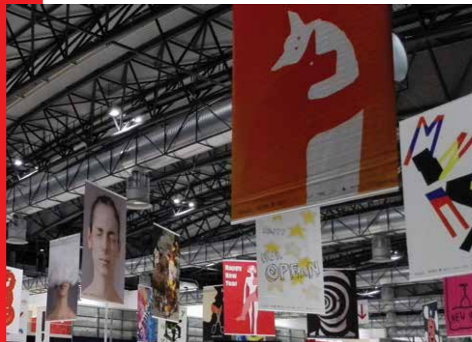
Výstava Ladislav Sutnar - Evropa, kultura v Praze na Letišti Václava Havla.