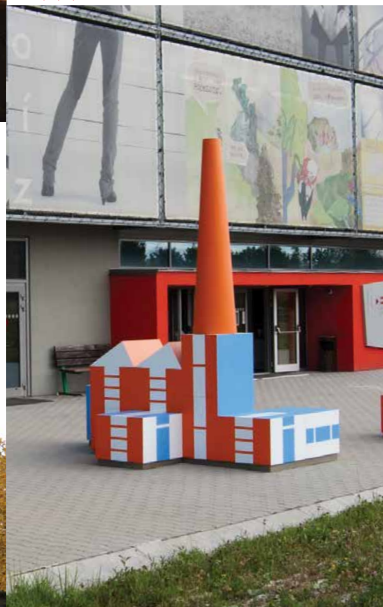
Socha – stavebnice Build the Town před budovou Sutnarky.