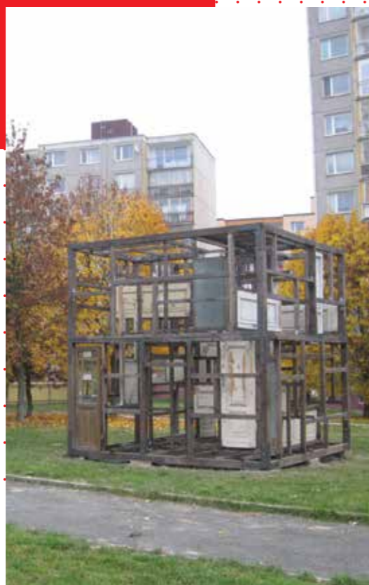
Socha Krychle Petra Filipa.