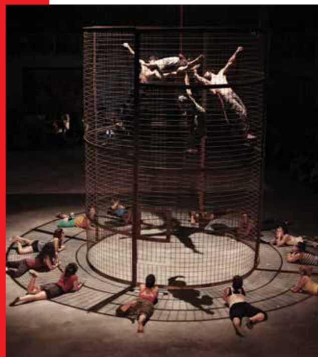
Modeli da Torino - představení studentů Cirkusové školy Flic z Turína v režii Petra Formana.