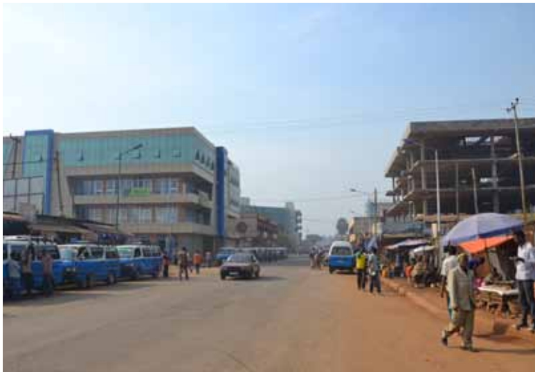
Centrum afrických studií se zaměřuje na výzkum Rohu Afriky.

Katedra archeologie se podílela na založení Archeocentra v blízkosti Historického parku Bärnau-Tachov. Vzniknou zde dílny a venkovní laboratoře, kde bude možné pracovat s různými materiály používanými v minulosti a ověřovat středověké stavební techniky.