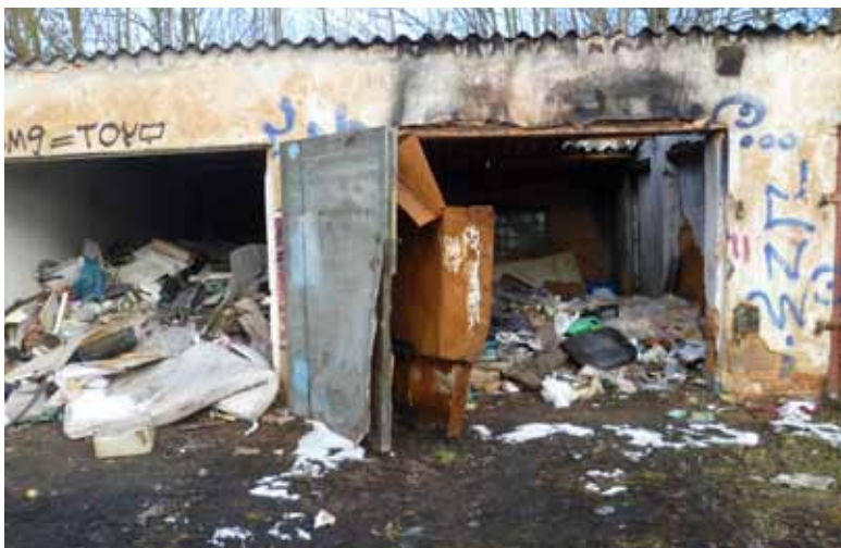
Záběr ze sociologického výzkumu Fenomén bezdomovectví.