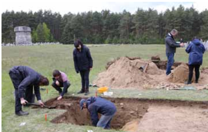
Vyhlazovací tábor Treblinka. Odkryv prostoru, kde byly zemním radarem zachyceny pozůstatky plynových komor.