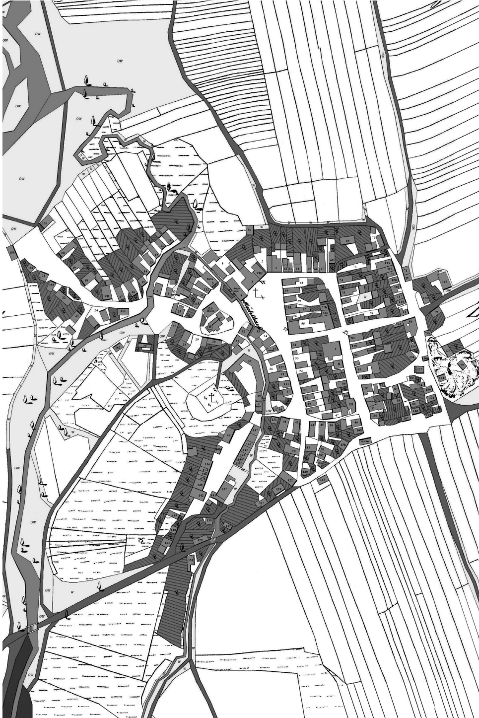
Rekonstrukční mapa zástavby v Janovicích nad Úhlavou s čísly popisnými na podkladě mapy stabilního katastru (1837). Autor: Jan Lhoták, 2007.