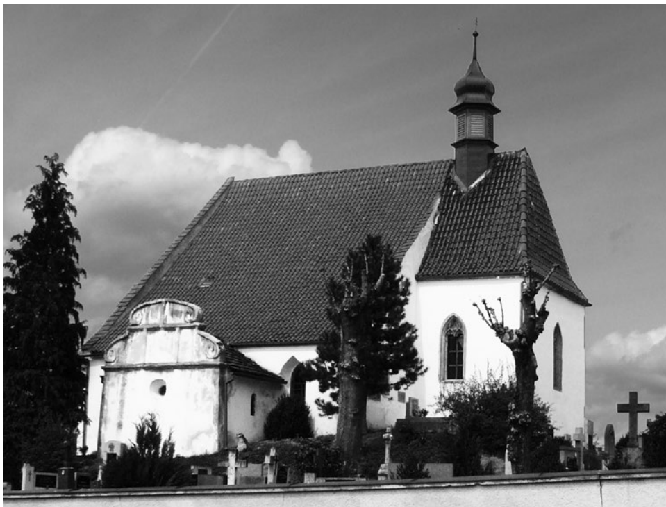
Pohled na kostel sv. Jilji od severu, foto Radovan Váchal, 2013. http://foto.mapy.cz/353315-Svihov-Kostel-sv-Jilji