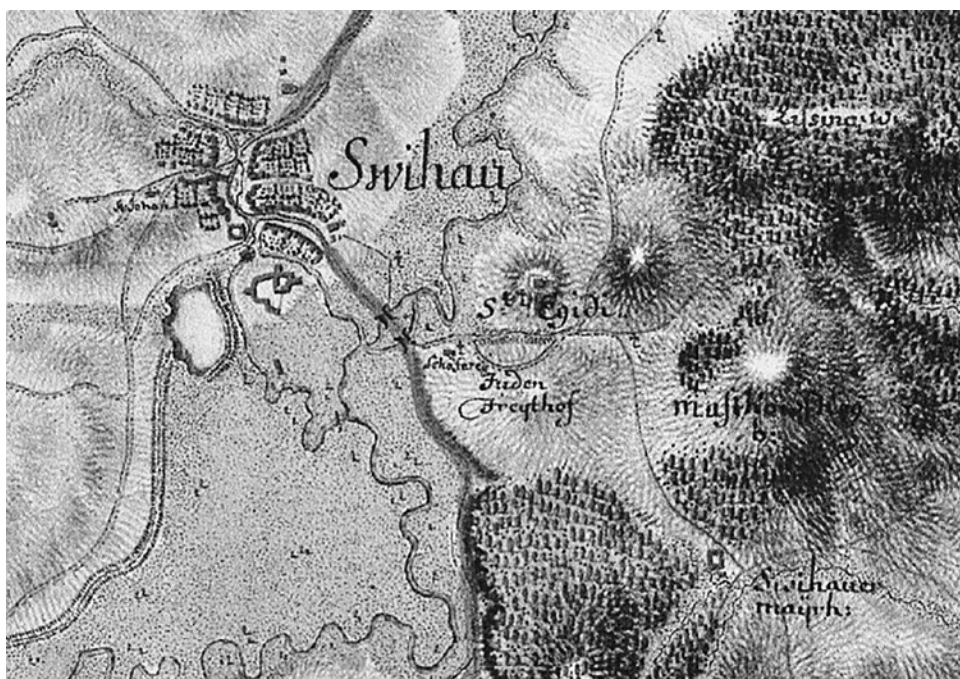
Ostrožna s kostelem sv. Jilji (St. Egidii) na mapě I. vojenského mapování, 1764–1768