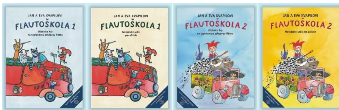
Obrázek 4: Flautoškola 1 a 2

Ke každému dílu této řady učebnic autoři napsali také metodický sešit pro učitele, který slouží jako pomůcka při práci s učebnicí a nabízí další myšlenky a návrhy pro obohacení výuky.