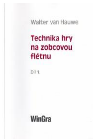
Obrázek 5: Technika hry na zobcovou flétnu 1. díl

Většina učebnic hry na zobcovou flétnu je založena na principu rychlého dosažení výsledků, což rodiče očekávají. Tato učebnice je zaměřena na techniku a členěna do čtyř oddílů. Jak držet zobcovou flétnu, jak hýbat prsty, jak dýchat a jak artikulovat.