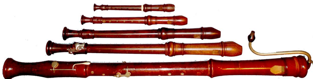
Obrázek 1: druhy zobcových fléten (sopraninová, sopránová, altová, tenorová, basová)

Sopraninová zobcová flétna – je z celé flétnové rodiny nejpoužívanější flétnou ve vysokém ladění. Je dlouhá 22 cm a široká asi 5 cm. Díky těmto parametrům vzniká v korpusu flétny vysoká frekvence vzduchového válce, která určuje rozsah flétny od f^2 až g^4 . Většinou je tato flétna dvoudílná (hlavice a tělo). V období baroka byla také často využívána jako sólový nástroj.