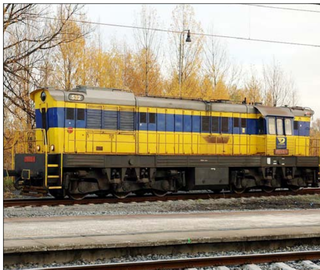
Obr. 4 – lokomotiva 669