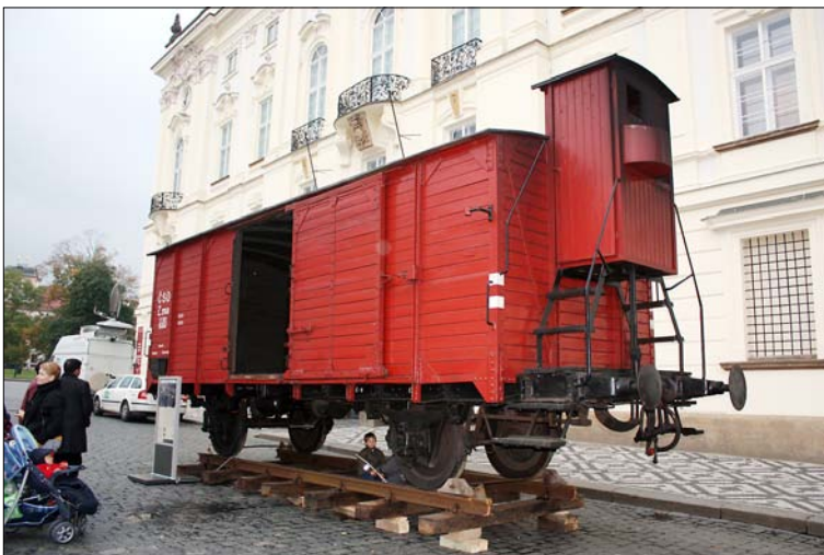
Obr. 6 – vůz s brzdařskou budkou

Brzdění vlaku je mírně odlišné. V moderních soupravách jsou brzděna kola všech vagonů – na každou tunu hmotnosti vlaku připadá klidová třecí síla 1,5 kN. Dříve bylo běžné, že vlak brzdila jenom lokomotiva, případně byly ručně bržděny pouze některé vagony v soupravě – často docházelo k haváriím, kdy brzděná kola přešla do smyku, a přesto nedokázala vlak zastavit.