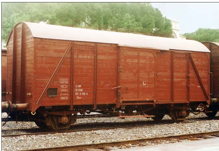
Obr. 2 – vagon Ztr

dává po rovině valivý odpor pouhých 293 N! Při pohybu se projevuje i tření v ložiscích, ale z vlastní zkušenosti vím, že po uvedení do pohybu stačí na tlačení tohoto vagonu po vodorovných kolejích jeden muž.