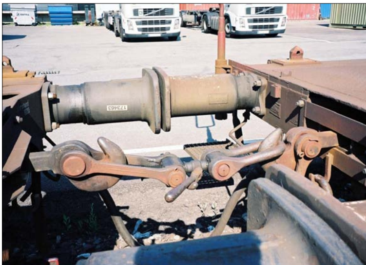
Obr. 5 – šroubovka

Šroubovky se podílí na jevech spojených s vedením vlaku „s postrkem“ – tj. jedna lokomotiva v čele a druhá na konci vlaku (běžná výpomoc například na trati z Tišnova do Říkonína – odtud se výpomocná lokomotiva vrací zpět do Tišnova). Lokomotivy si silové působení na vlak rozdělí snadno – přední lokomotiva za sebou vleče přední část vlaku na napnutých šroubovkách a zadní lokomotiva tlačí zadní část vlaku na natlačených náraznicích. Není tedy problém použít na postrku slabší lokomotivu – tlačí si svou (kratší) část vlaku. Další podrobnosti najde případný zájemce např. v [3].