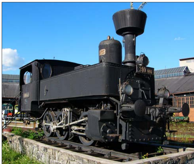
Obr. 3 – lokomotiva 310

Rozhodující je síla přitlačující kolo ke kolejnici – v „nádražácké“ hantýrce se jí říká „nápravový tlak“. Železniční technické normy bohužel nerespektují normy fyzikální a namísto síly v newtonech udávají „nápravový tlak“ v tunách. Z důvodu přehlednosti se ve zbytku článku podvolíme železniční terminologii (stačí si uvědomit, že „nápravový tlak 1 tuna“ znamená přitlačnou sílu o velikosti 10 kN). Staré lokální tratě byly stavěny pro nápravové tlaky do 10 tun, moderní tratě jsou stavěny pro nápravové tlaky kolem 20 tun.